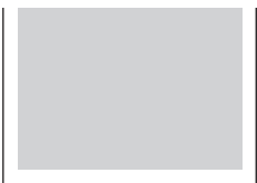
1/2 sivu vaaka 210 x 148 mm, * 181 x 130 mm