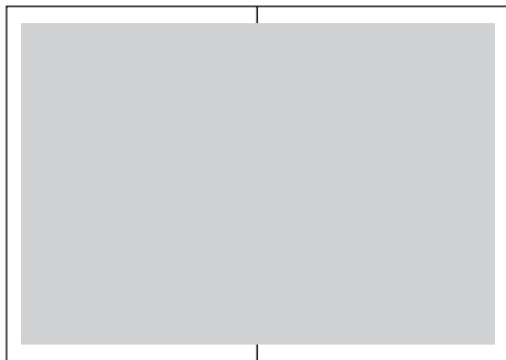
Koko aukeama A3,420 x 297 mm, * 386 x 262 mm