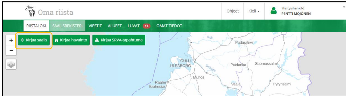
Kuva 1. Riistaloki-valikko