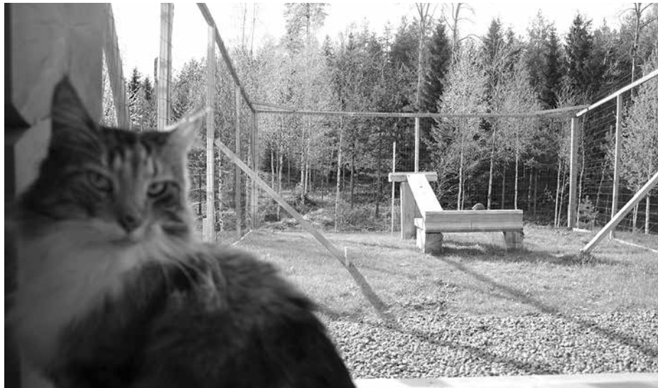
Tässä terassin yhteyteen rakennetussa tarhassa on katon sijasta 30 cm lieve, joka estää sen käyttäjiä kiipeämästä aidan yli.

Tarhan paikka on myös syytä suunnitella tarkkaan. Tasamaa on tietenkin paras rakennuslusta. Esteetön