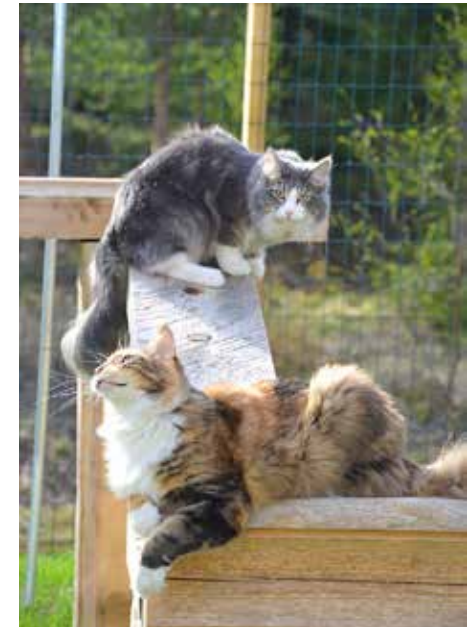
Puu on kelpo materiaali kiipeilytelineille.

TEKSTI RIIKKA VIRTANEN KUVAT ELLI-MARI AHOLA