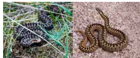
Kyykoiras ja kyynaaras

Käärme ei yllä puremaan kovinkaan korkealle. Vaistomainen suojautumismekanismi kyyille