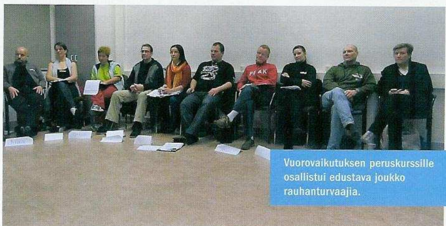
Vuorovaikutuksen peruskurssille osallistui edustava joukko rauhanturvaajia.

Teksti: Teija Miettinen ja Henry Helakorpi