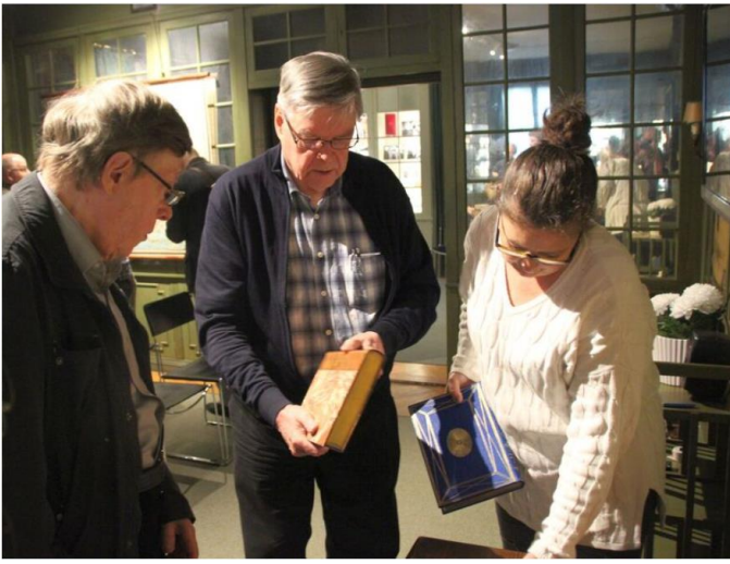
Jäsenistö tutustuu kirjoihin

Ahkerana lukijana marsalkalle kertyi kokoelmaansa yhteensä noin 5300 teosta. Suuren osan kirjoista hän sai lahjoituksina. Kirjasto on nykyään tarkasti luetteloitu, ja kirjastoluettelon julkisti vuonna 2016 rouva Jenni Haukio. Noin kymmenessä prosentissa kirjoista on Mannerheimin Exlibris, noin viidessä prosentissa hänen nimikirjoituksensa. Kirjastomateriaali on