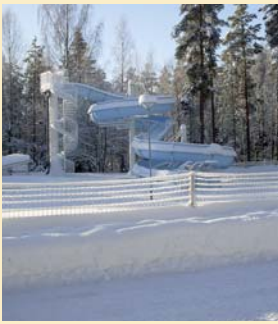
Kannen kuva: KUNKUN TALVI, Altti Aronen