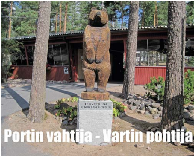
Portin vahtija - Vartin pohtija