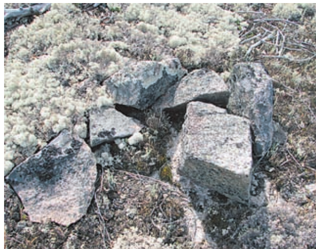
Mikähän on tällaisten kiviröykkiöiden tarina?