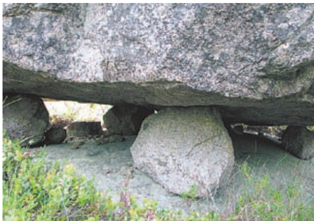
Kauniskankaan kivipöydän jalat ovat erikokoisina asettuneet kuin ihmeen kaupalla siten että niiden päällä oleva kivipöytä on vaakatasossa kuperalla kalliolla.