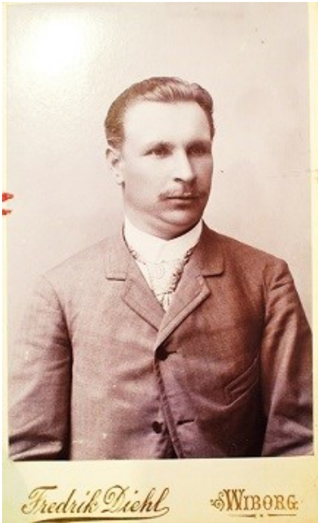
Pohjoismaiden Osakepankin Savonlinnan konttorin asiamies, 1889