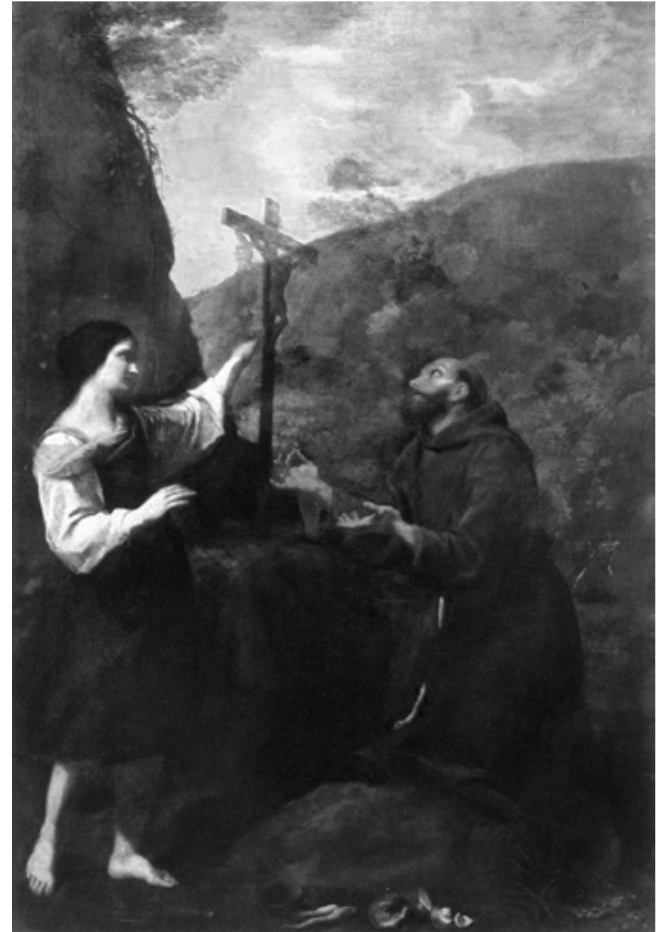
P. FRANCISCUS JA ROUVA KÖYHYYS. ANDREA SACCHI, 1633.

Toisaalta Franciscus tunnisti maailmassa vallitsevan yhteiskunnallisen köyhyyden tilan . Hän tunsu syvää myötätuntoa yhteiskunnallisesti köyhiä kohtaan ja pyrki auttamaan heitä kaikin käytettävissä olevin keinoin. Hänen tavoitteensa oli herkistää veljeskuntansa köyhien tarpeille nähden että vain se, joka on itse vapaa rikkaudesta ja itsekkyydestä, voi ymmärtää osattomia. Franciscukselle köyhyys oli omansa jakamista vähäosaisten ja yhteiskunnan ulkopuolelle suljettujen kanssa, solidaarisuut-