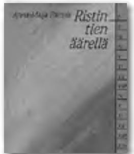
Anna-Maija Raittila: Ristin tien äärellä (vanha painos) 6 €