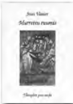
Jean Vanier: Murrettu Ruumis 10 €

Tilaukset verkkokaupasta: http://www.sinapinsiemen.fi/tuotteet.html tai sähköpostilla: ukinranta@sinapinsiemen.fi