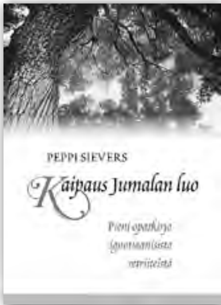
Kustantaja Sinapinsiemen, hinta 15 €

Kirjoittaja on Ukinrannassa asuva Sinapinsiemen ry:n jäsen ja hengellinen ohjaaja.