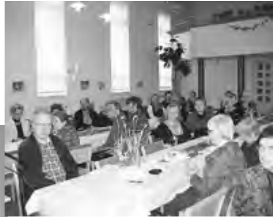
Kevätseminaarissa Pakilan Hyvän Paimenen kirkolla oli viitisenkymmentä osanottajaa

Nyt näitä ”chhatralayoja” Gujaratin alueella 150 ja niissä opiskelee noin 40 000 lasta. Oppilaat saavat koulussa majoituksen ja ateriat, mikä merkitsee köyhille lapsille paljon. Yli puolet oppilaista on nyky-