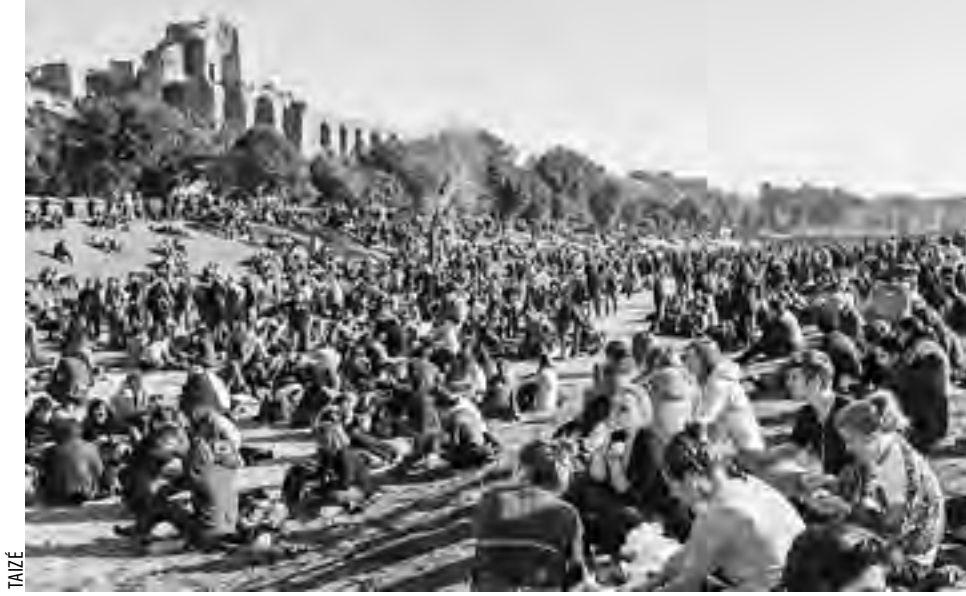
Taizé, Rooman kokous 2013