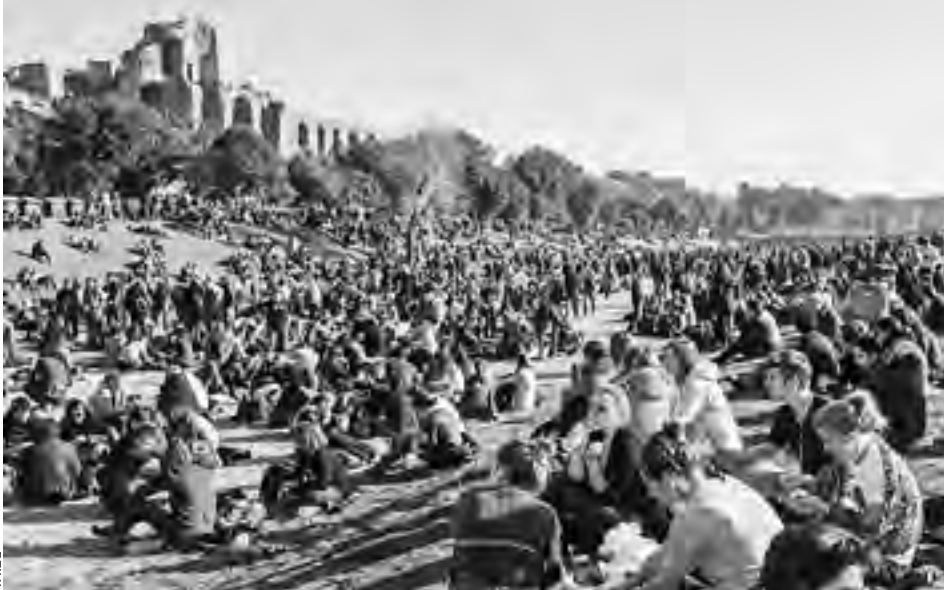
Taizé, Rooman kokous 2013