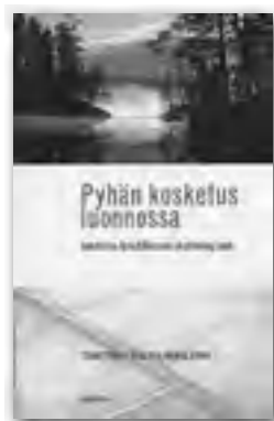
Kainulainen, Pauliina, PYHÄN KOSKETUS LUONNOSSA Johdatus ekoteologiaan, 30 €

www.sinapinsiemen.fi/tuotteet.html Kirjoja saa myös käteisellä Ukinrannan myymälästä.