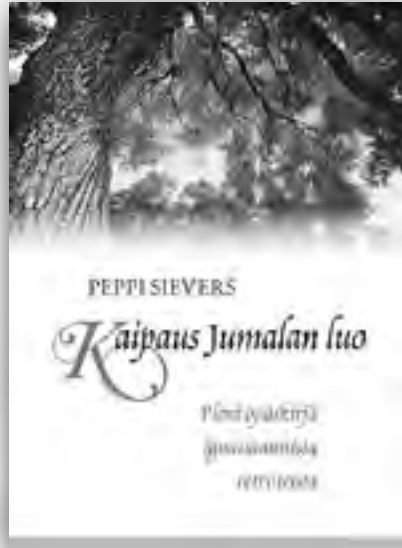
Peppi Sievers: Kaipaus Jumalan luo. Pieni opaskirja ignatiaanista retriiteistä. Sinapinsiemen ry 2012

Lähtökohtana harjoituksille on se, että ihminen voi olla dialogisessa vuorovaikutuksessa Jumalan kanssa. Jumalan hyvyys ja rakkaus vetää meitä parannukseen ja herättää kaipauksen kokea ja välittää yhä enemmän tuota rakkautta. Täysimittaisissa kolmenkymmenen päivän harjoituksissa ensimmäisen viikon fokuksena on synty, toisen viikon Jeesuksen elämä maan päällä inkarnaation ihmeestä palmusunnuntaihin, kolmannella viikolla seurataan Jeesuksen kärsimystä ja kuolemaa hautaan saakka ja neljännen viikon fokus on ylösnou-