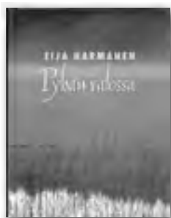
Harmanen, Eija, PYHÄN VALOSSA, 25 €