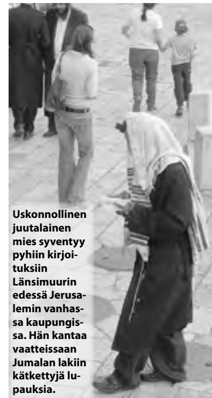
Uskonnollinen juutalainen mies syventyy pyhiin kirjoituksiin Länsimuurin edessä Jerusalemin vanhassa kaupungissa. Hän kantaa vaatteissaan Jumalan lakiin kätkeytyä lupauksia.

3. Jätä tilaa ”pyhälle kateudelle”; sille, että toisen uskonnosta voi löytyä joitain sinulle vieraita ulottuvuuksia, joita voit op-