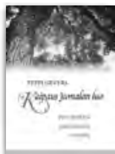
Sievers, Peppi, KAIPAUS JUMALAN LUO Pieni opaskirja ignatiaan- nisista retriiteistä, 15 €