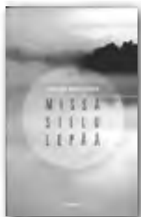
Kainulainen, Pauliina, MISSÄ SIELU LEPÄÄ, 27 €