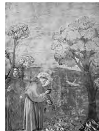
Pyhä Franciscus saarnaa linnuille, Giotton tunnettu maalaus.