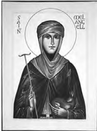
Pyhä Melangell (k. 641) tunnetaan jänisten ja kaniin suojelepyhimyksenä.

MELANGELL (k. 641) oli hurskas neitsyt, joka eli Walesissa yksinäisyydessä ja rukoushiljaisuudessa. Hän rukoili mieluiten luonnon keskellä, taivassalla. Ollessaan taas keran rukoilemassa hän ei lainkaan kuullut metsästystorvien soittoa ja koirien haukuntaa – eikä huomannut, että säikähtynytjänis juoksi turvaan hänen viittansa liepeisiin. Kun metsästysretkeä johtanut prinssi komensi koiria jäniksen kimppuun, ne eivät suostuneet hievahtamaanakaan. Joutuivatko koiratkin kontemplaation tilaan? Hämmenny-