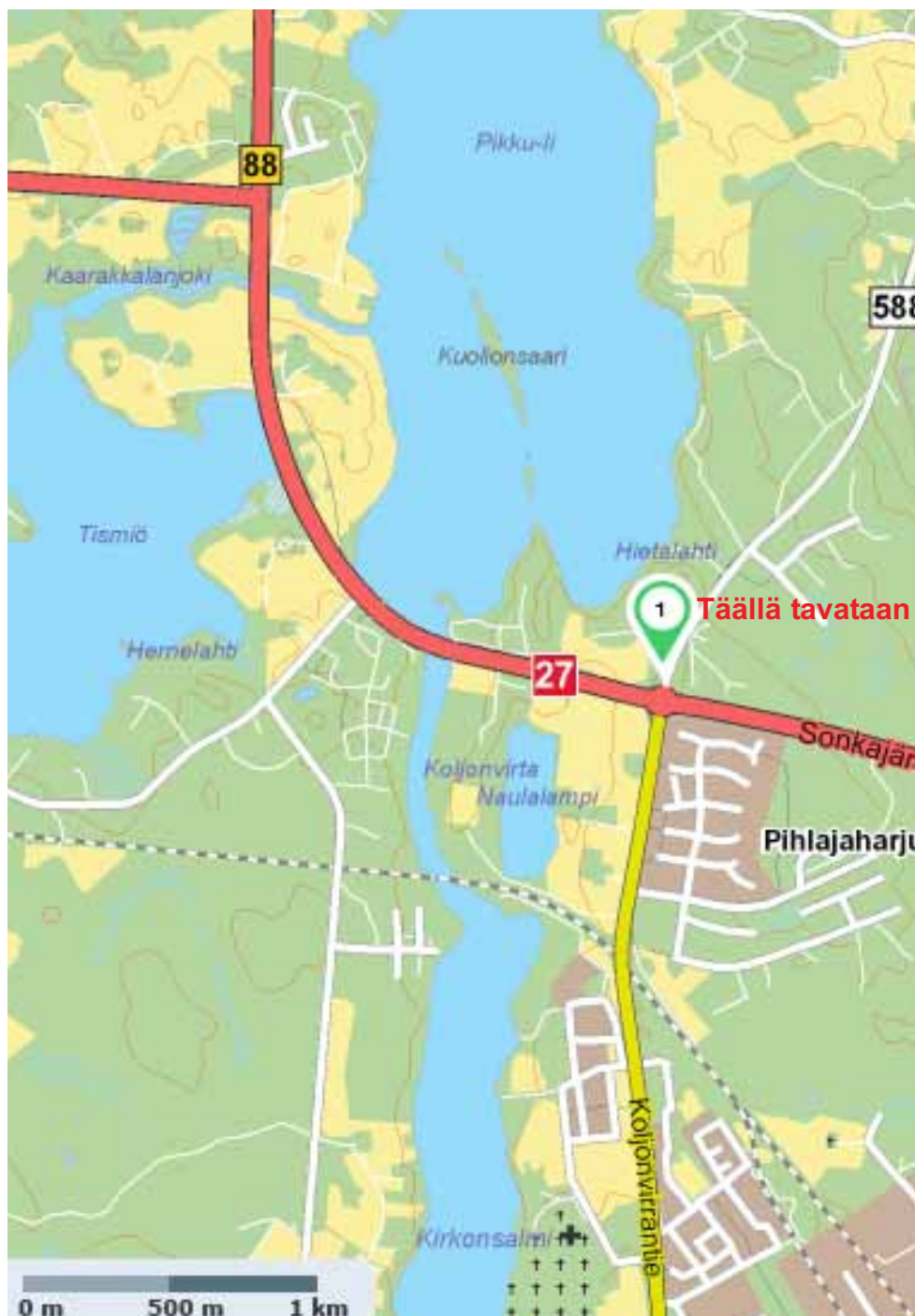
suku 27 viesti