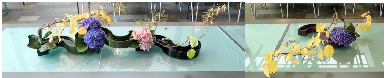
Yllä yleiskuva ja sen alapuolella asetelmat Soile ja Laila