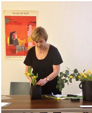
Jaana demoaa ws 1

Iltapäivällä Elizabeth Asikaisen vetämään ”Taidetta pajusta” asetelmaan tuli sisällyttää myös teemat suorat ja kaarevat linjat sekä materiaalin muuntaminen. Osallistujia oli 14.