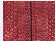
Vedenkestävä spiraali C2