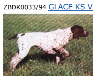
ZBDK0033/94 GLACE KS VOM HEGE-HAUS