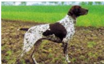
ZBDK0373/97 VLIES KS VOM HEGE-HAUS