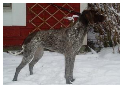
FIN27310/01A FIN MVA PITKÄSAAREN ESSI