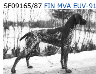
SF09165/87 FIN MVA EUV-91 PRUUKIN API