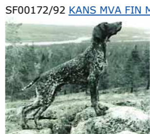
SF00172/92 KANS MVA FIN MVA S MVA URIEL VOM HINSCHEN-HOF