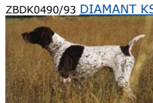
ZBDK0490/93 DIAMANT KS VOM HEGE-HAUS