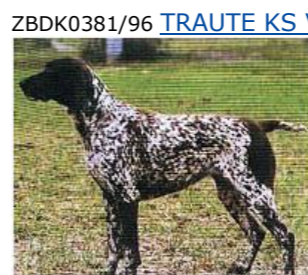
ZBDK0381/96 TRAUTE KS VOM HEGE-HAUS