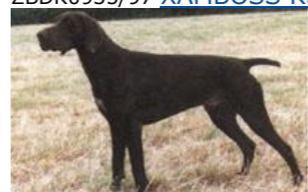
ZBDK0935/97 XAMBOSS KS VOM HEGE-HAUS