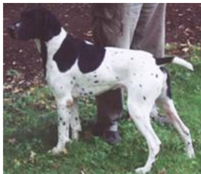
ZBDK0740/00 INGOLF VOM HEGE-HAUS