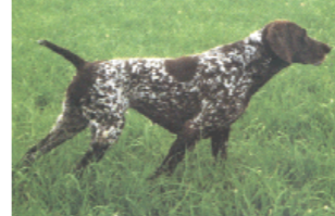
ZBDK079693 FIRN KS VOM HEGE-HAUS