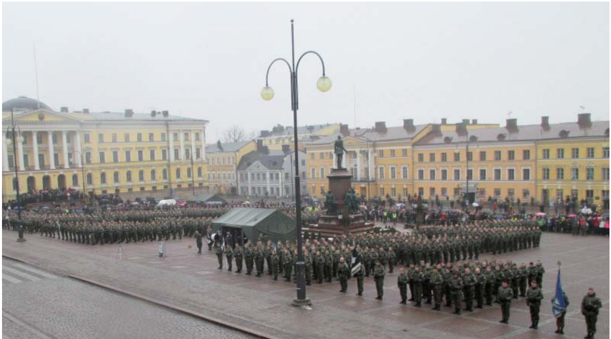
Noin tuhat alokasta lähinnä Kaartin Jääkärirykmentistä ja Helsingin Ilmatorjuntarykmentistä antoi sotilasvalan tai juhlallisen lupauksen Helsingin Senaatintorilla 22.2.2014. Ohimarssissa ja paraatikatselmuksessa esiteltiin uuden ilmatorjunta-aseistuksen ohella myös 70 vuoden suurpommitusten aikaista ilmatorjuntakalustoa.