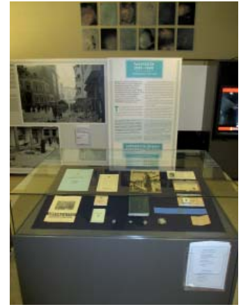
Virka Galleriassa avatussa Helsingin suurpommituksista helmi-kuussa 1944 kertovassa näyttelyssä myös Kilta oli omalla vitriinillään näkyvästi esillä.

Näyttelyesineistö muodostuu kuvista, lentopommeista ja vitriini-esineistä. Siellä on myös vitriini, joka sisältää yksinomaan sotilaspoika- ja pikulotta-aiheisia muistoesineitä ja julkaisuja. Tämä vitriini on näyttelyssä hyvin edustavalla paikalla. Se on yllättävän suuri ja elegantti. Kiltamme näyttelyyn lainaama materiaali on sijoitettu vitriiniin hyvin järjestelmällisesti ja kauniisti. Minun on tunnustettava, että haukoin henkeäni nähdessäni sen. Kiitokseni näyttelyn rakentajille meidän kaikkien puolesta!