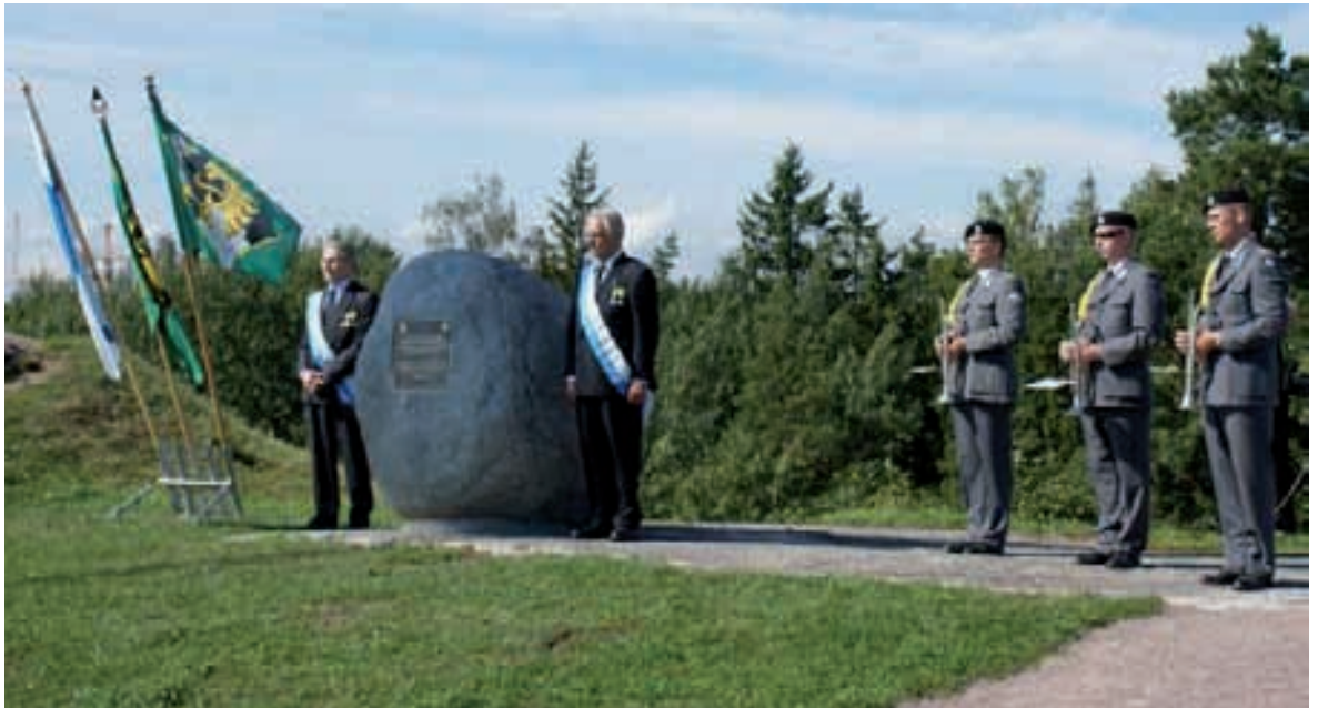
Patsas on paljastettu