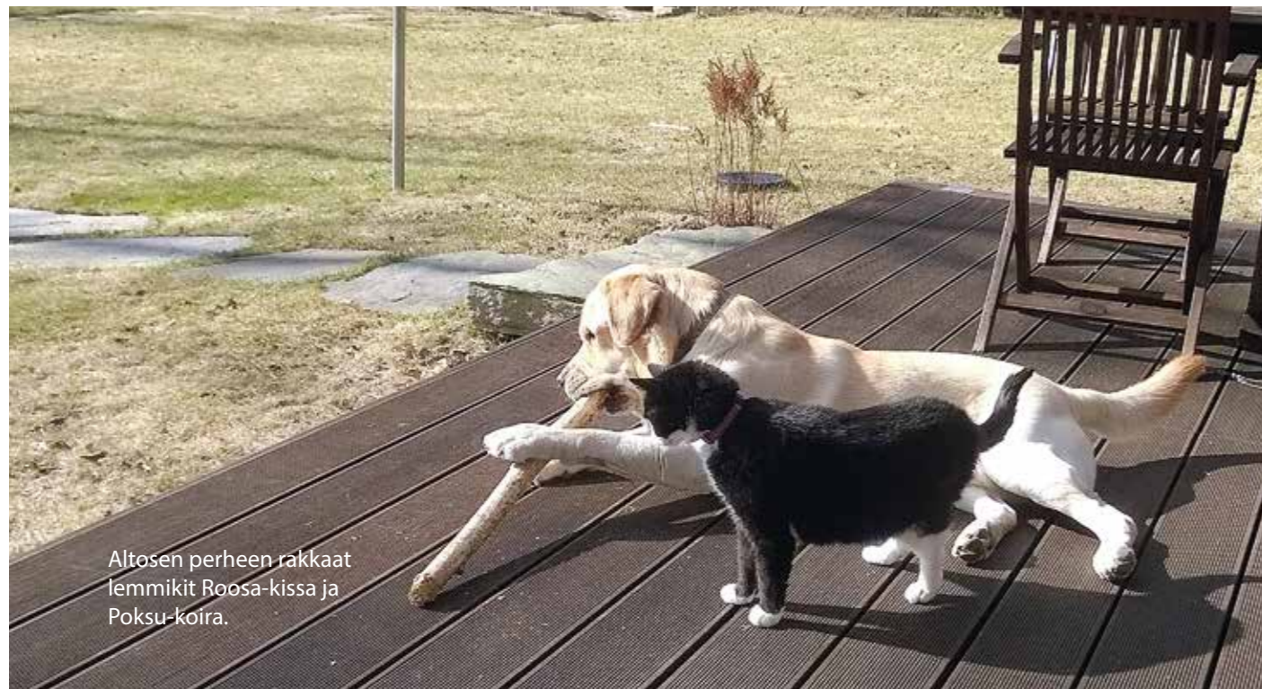
Altosen perheen rakkaat lemmikit Roosa-kissa ja Poksu-koira.

misilmoituksesta, ja veimme kissan yhdessä hänen kanssaan kotiin. Hänellä oli kaksi muuta kissaa ja huomasi, ettei omistaja ollut oikein hyvissä varoissa. Kävimme mieheni kanssa vielä kaupassa ostamassa kassillisen kissanruokaa rouvalle. Veimme vielä jouluksi kissoille ruokakassin. Soitin omistajalle joskus ja hän oli hyvin onnellinen, että sai kissansa takaisin. Kysyin myös Taivaan Isältä tilanteesta ja sain vastauksen, että omistaja huolehtii hyvin kissoistaan.”