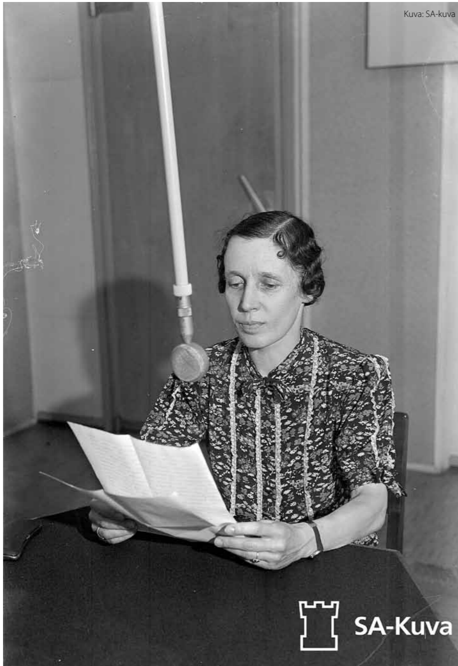
Rouva Ryti pitää puhetta. Helsinki 5.7.1941.

Huhtikuussa 1938 Gerda Ryti kuuli ensimmäisen kerran oman henkioppaansa puhuvan. Meni aikaa ennen kuin sopivat muodot löytyivät. Aluksi opas tuli ja meni miten halusi ja neuvot olivat kovin kummallisia, mutta harjoit-