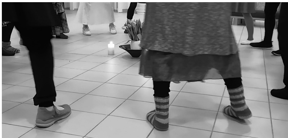
Pirkkalan seurakunnassa vietettiin talvella 2020, ennen korona-aikaa, Pyhän tanssin päivää. Kuva: Tuula Mannermaan kuvaamasta videosta.

keiden avulla. Kehorukous ei ole harjoiteltu esitys, jolloin syntyy ristiriita. Katsoja voi olettaa näkevänsä harjoitellun taiteellisen esityksen, mutta ”esiintyjän” rukous on sisäistä ja liike on vain auttamassa häntä syventymään rukoukseen. Hänen sisäisyytensä ei näy katsojalle ulkoisesti, jolloin voi tapahtua vääriä tulkintoja ja vääринymmärryksiä, kun liikkeiden laatua ei ole harjoitettu esitettäväksi. On päädytty kompromissiin, jolloin Pyhää tanssia tanssivat asettuvat aika ajoin myös esiintyjän rooliin, jolloin tansseja harjoitellaan etukäteen, vaikka osallistujat ovat harvoin koulutuksen saaneita ammattitanssijoita, joilla olisi edellytykset luoda viimeistelty taideteos. Sellainen voi toki joskus syntyä ilman ammattilaisuuttakin. Siirtymä eriluonteiseksi tapahtumaksi tapahtuu hetkessä, jolloin päätetään, että tietystä tanssista tehdään esitys. Tällöin sitä muokataan katsojan näkökulma huomioiden. Ammattitanssijan ammattitaitoon kuuluu hallita tanssin tekniikka ja tulkinta. Taiteelliseksi luomistyöksi esitys muuttuu silloin, kun tanssija pystyy tuomaan läsnä olevaksi jotakin, jonka hän on hengessään tavoittanut. Nämä seikat on hyvä huomioida, kun eleitä, liikkeitä ja tanssia tuodaan kirkkotilaan.