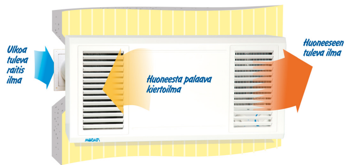
Kuvassa vasenkätinen (tuloilmakammio vasemmalla)