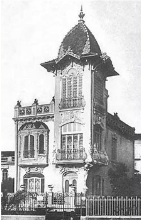
Villa Huovila 1900-luvun alussa

Lehdessä mainitaan myös yhteinen joulunvietto v.1932 suomalaisten ensimmäiseksi yhteiseksi hetkeksi Nizzassa ja toivomus sen jatkumisesta.