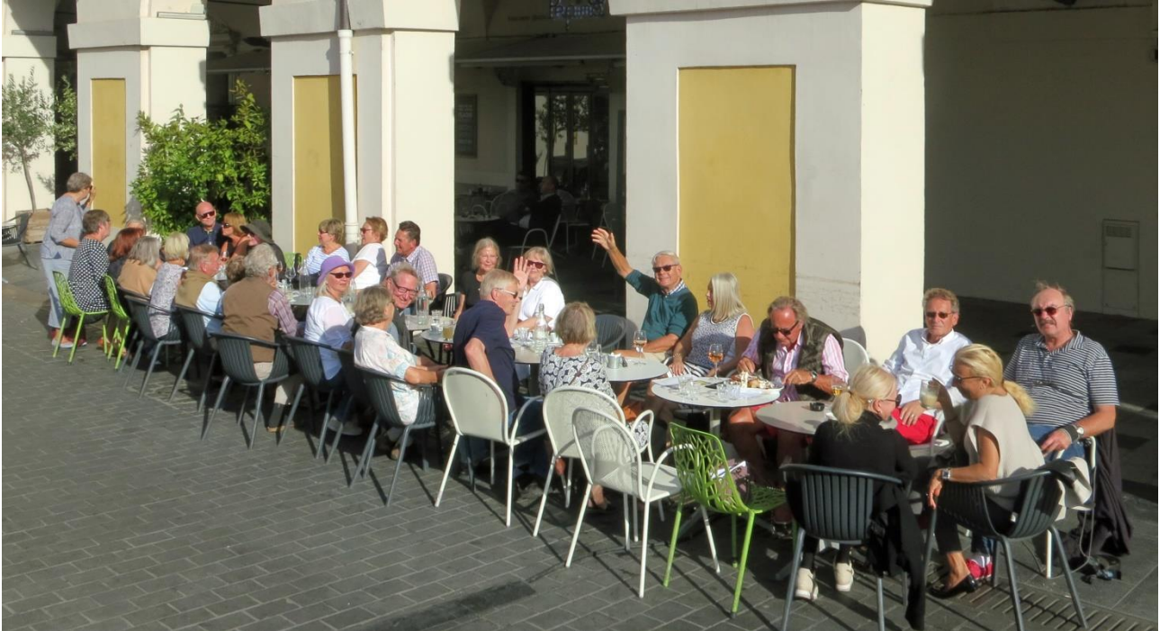
Tiistaisin tavataan Place Garibaldilla

rupattelemassa jopa 54 henkeä. Yksi tiistaikahvilan suosion syy lienee siinä, että tapaamiset ovat epämuodollisia ja kaikille avoimia eikä niihin tarvitse ilmoittautua etukäteen. Ensimmäiset seitsemän vuotta kahvilatapaamisten paikkana oli Pepino-ravintola, jolle pysyttiin uskollisena, vaikka omistaja ja palvelun tyyli vaihtuivat.