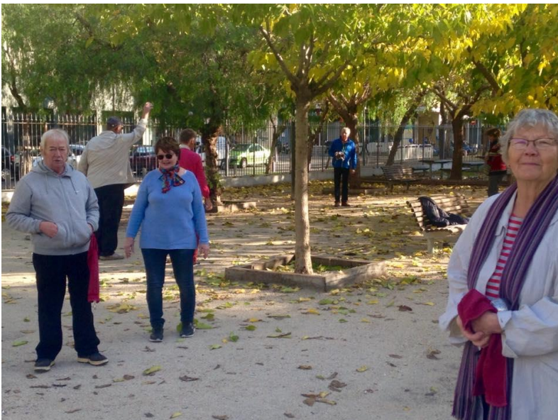
Place Arsonin perjantaipetankistit