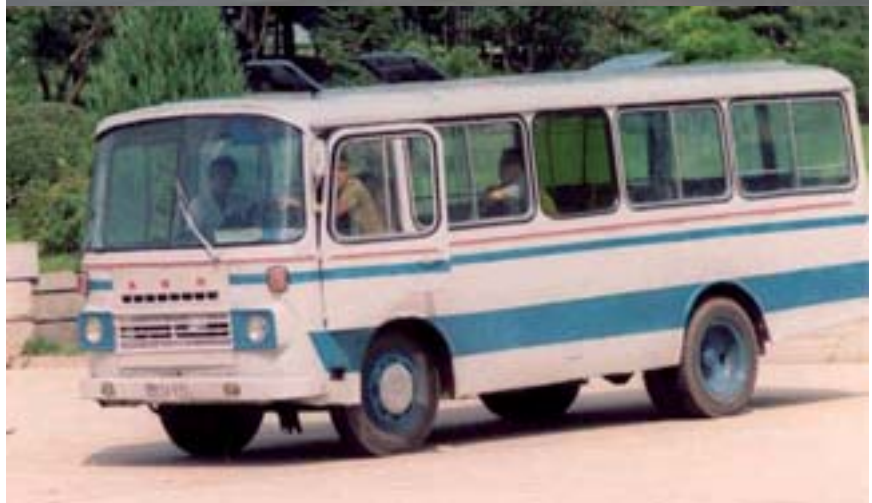
Johdinauto Chollima 091 (yllä) ja pikkubussi Jipsan 82.

dollistaa liikennöinnin hetken aikaa myös ilman johtoja.