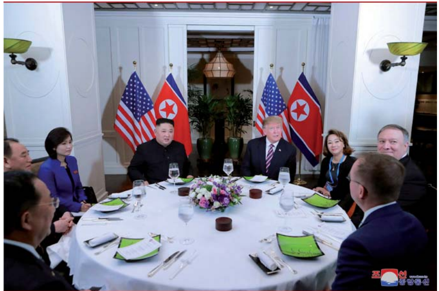
KDKT:n ja USA:n valtuuskunnat illallisella.

Huolimatta siitä, että konkreettisia tavoitteita ei saavutettu, KDKT suhtautui varsin postitiivisesti kokouksen ilmapiiriin ja