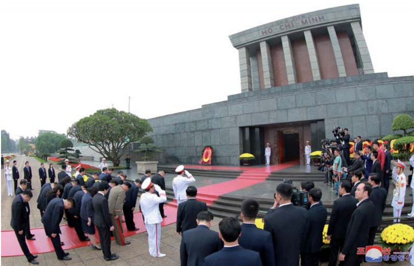
Puheenjohtaja Kim Jong Un vieraili Ho Tsi Minin mausoleumissa.

Kim ja Trumpin huippukokouksen jälkeen Kim Jong Un jatkoi virallisella kaksipäiväisellä valtiovierailulla Vietnamissa.