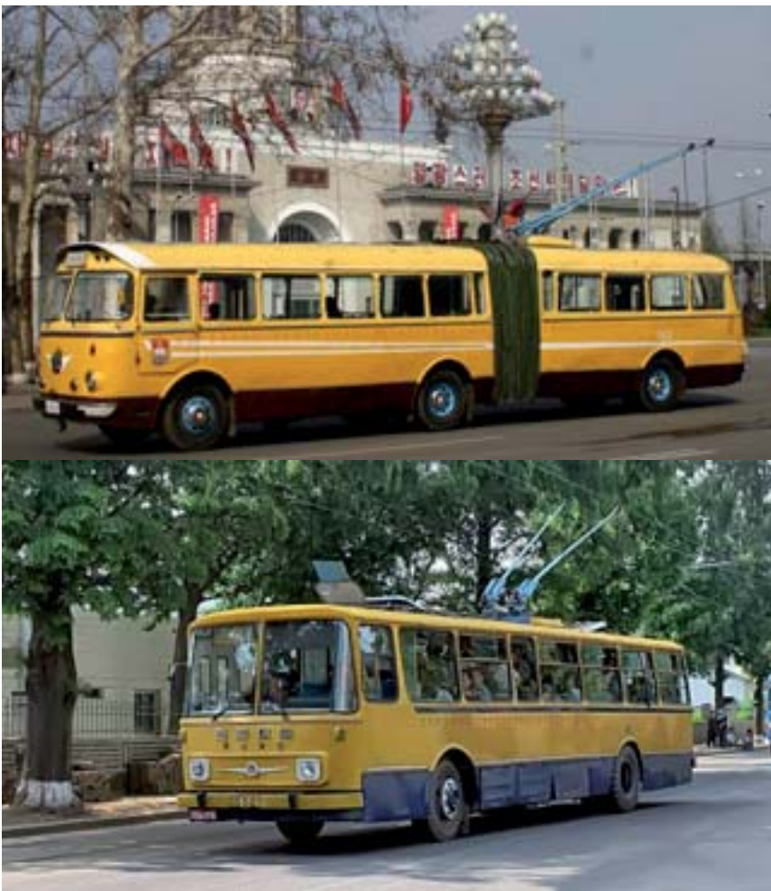
Johdinautot Chollima 9:25 (yllä) ja Chollima 79.

Chollima 70 oli uudistettu kaksiakselinen johdinauto, jota valmistettiin vuosina 1970-1972