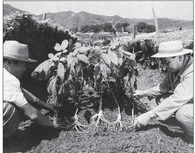
Insamtila Kaesongissa. Taustalla näkyvät suojarakenteet, joiden alla insam on suojassa auringolta ja sateelta.

Insamin viljelymenetelmän kehittivät koguryolaiset maanviljelijät noin 100-luvulla eaa. Ri-dynas-