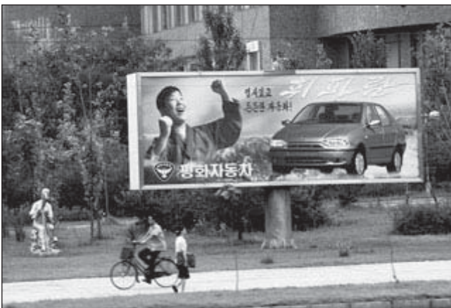
Hwiparam auton mainos Pjongjangissa.

Jokainen Korean demokraattisessa kansantasavallassa käynyt on maassa olleensa kuullut taatusti Hwiparamin. Kyseessä on erittäin suosittu laulu, joka kirjaimellisesti tarkoittaa vihellystä. Laulu kertoo nuoresta naisesta, jonka parvekkeen