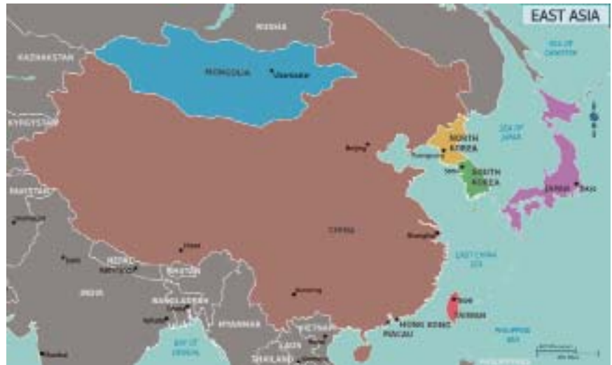
Yhdysvallat hämmentää geopolittista soppaa Itä-Aasiassa.

Siellä on merkittävä Etelä-Korean armeija, joka on jo Yhdysvaltain komennossa ja tottunut Yhdysvaltojen hallintaan. Etelä-Koreassa on valtavia Yhdysvaltain tukikoh-tia, ja sillä on tilat vahvistusten nopeaan tuomiseen ja lähettämiseen, ja molempia on harjoitettu hyvin. Lisäksi Japani on Shinzo Aben johdolla pitkään ilmaissut innostuksesta puuttua konfliktiin Koreassa, eikä ole mitään syytä