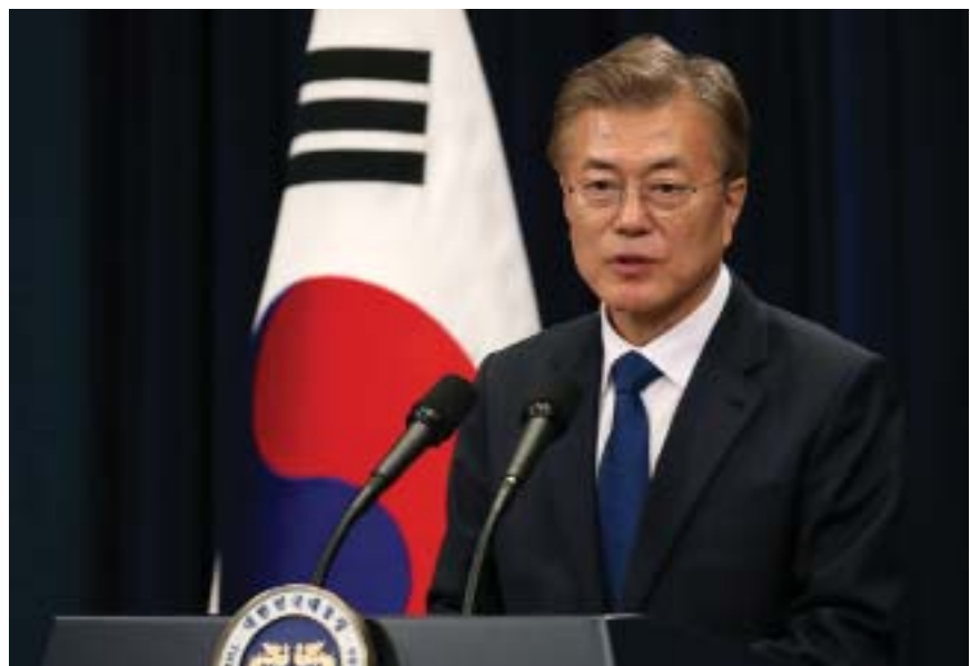
Moon Jae-in.

Yhdysvallat ei ole ainoa pohjoisen kanssa tehtävän liennytyksen vastustaja, jonka kanssa Moon joutuu kamppailemaan. Luonnollisesti vähemmän näkyvä ulkopuolisille tarkkailijoille, mutta varmasti voimakas on Etelä-Korean valtava sotilaslaitos ja National Intelligence Service (entinen Korean CIA), joilla on ollut läheiset suhteet yhdysvaltalaisiin kollegoihinsa vuosikymmeniä. Myös oikeistopuolueet (kuten tärkein konservatiivinen People Power Party) ja tiedotusvälineet, erityisesti Chojoongdong, ultrakonservatiivisten lehtien trio Chosun Ilbo, JoongAng Ilbo ja Dong-A Ilbo vaikuttavat näkyvästi yleiseen mielipiteeseen.