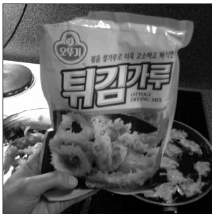
Friteerausjauhetta, johon lisätään vain vesi