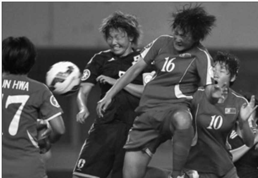
Naisten U19 loppuottelun tunnelmia Japania vastaan.

Heillä oli neljä yhteistä ottelua, joista kolmessa oli toisena avustavana erotuomarina Etelä-