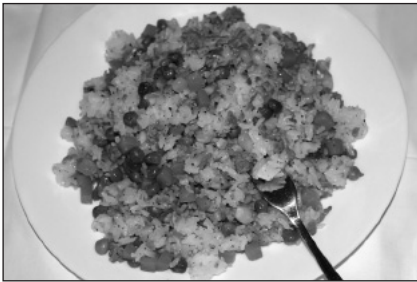
Swigogi yachae bibimbap

kivihannesten tapaan. Joukkoon voi lisätä esimerkiksi paprikaa ja sipulia.