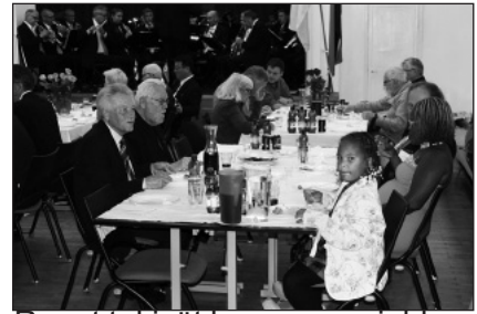
Ruutat tekivät kauppansa juhla- väelle

Saniaisista kerätään kasvin päässä oleva spiraalinmuotoinen osa, jonka jälkeen ne suolataan ja kuivataan hiljalleen auringossa. Tämän jälkeen kasvin osia liotetaan vedessä kaksi päivää, jonka aikana vesi myös vaihdetaan muutamaan otteeseen. Lopuksi saniaiset paistetaan ja maustetaan wok-