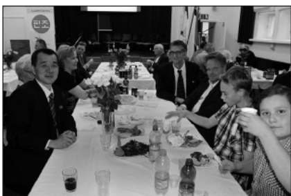
Juhlassa viihtyivät kaikenikäiset vieraat