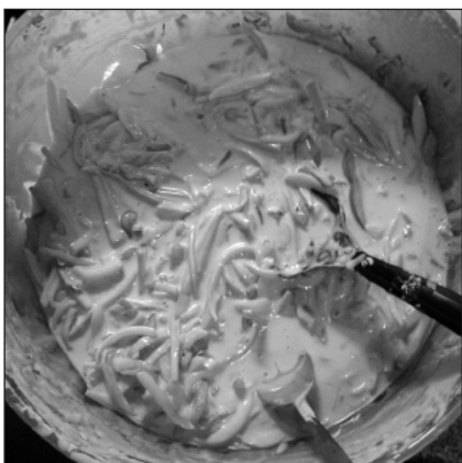
Yachae twigim taikinaseosta