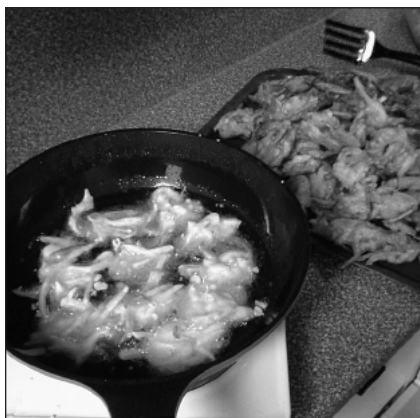
Seesamöljyssä friteerattuja kasviksia