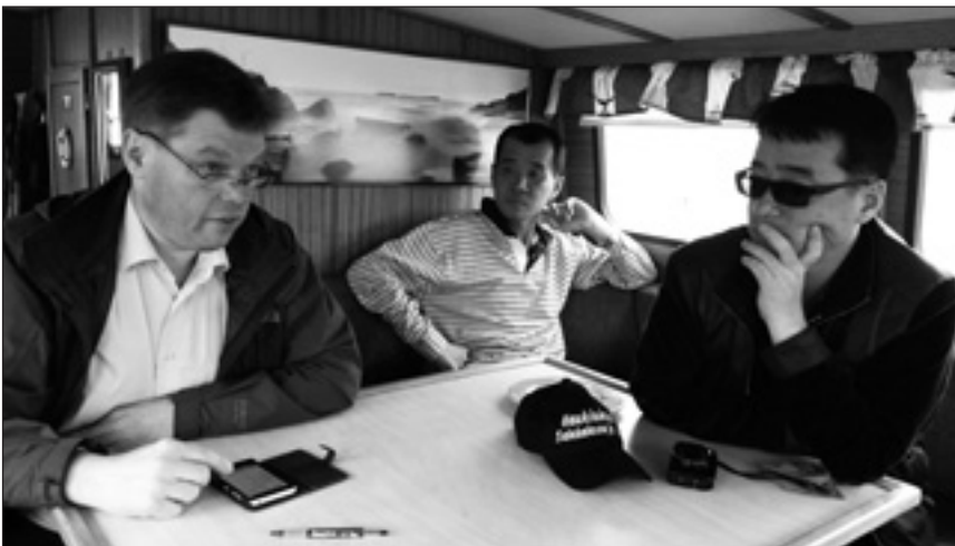
Risteilyllä Saimaalla. Risteilyllä sovittiin suomalaista Korea-ystävyytoimintaa kuvaavan dokumenttielokuvat toteuttamisesta.

Korealainen delegaatio palasi kotiinsa torstaina 10.9. Valtuuskunnan johtaja piti vierailua onnistuneena ja totesi, että viikossa alkaa jo saada käsityksen millainen maa Suomi on. Suomalaiset ja korealaiset ovat luonteeltaan samankaltaisia, joten heidän kanssaan on helppo ystäväystyä ja mutkatonta tulla toimeen.