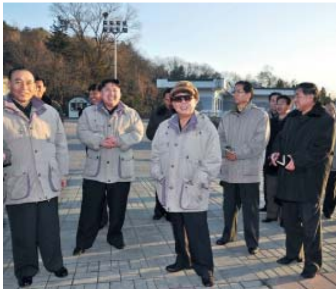
Pääsihteeri Kim Jong Il ja kenraali Kim Jong Un vierailulla Kaesonin huvipuistossa joulukuun alussa 2011.

katsovat Kim Jong Unin olevan uuden aikakauden johtaja, joka jatkaa Korean ikuisen presidentin Kim Il Sungin ja Kim Jong Ilin työtä. Pääpaino vuonna 2012 tulee olla kansalaisten elinolojen kohottamisessa, jonka edellytyksenä artikkelin mukaan on elintarvike- ja energiaongelmien pysyvä ratkaisu.