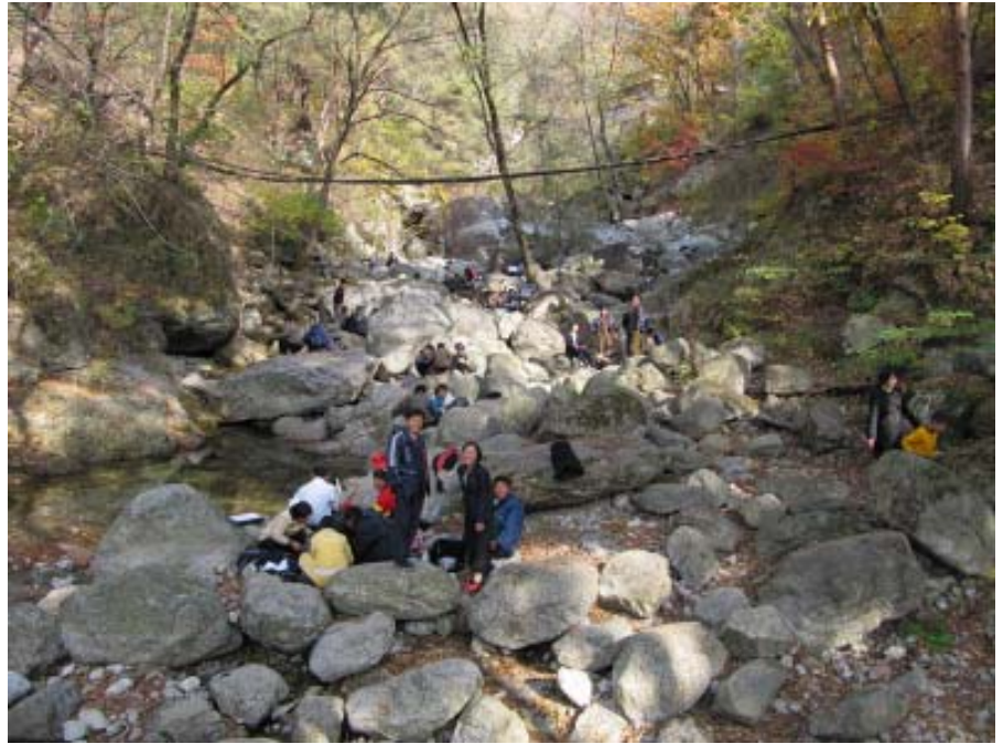
Korealaisia piknikillä Myohansanin biosfäärialueella. Piknikit ovat suosittu tapa vietää vapaapäivää Koreassa.

pinta-ala on 130 000 hehtaaria ja alueella asuu 35 000 ihmistä, jotka saavat elinkeinonsa maataloudesta, matkailusta, luonnonlääkekasvien viljelystä sekä luonnonmarjojen poiminnasta ja marjatuotteiden valmistuksesta. Paekdu-vuoristossa sijaitsee tärkeä japanilaismiehitystä vastustaneiden sissien tukikohta, mm. maan nykyinen johtaja Kim Jong Il syntyi siellä. Sen vuoksi alue on myös poliittisesti merkittävä ja siellä vieraileekin vuosittain 200 000 turistia.