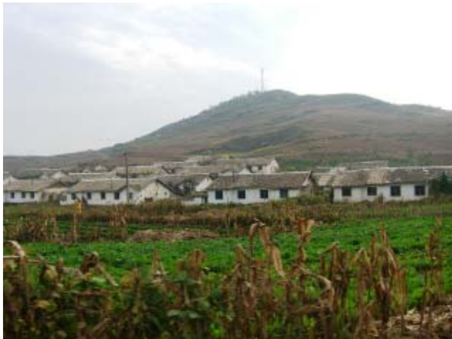
Korealaista maaseutua. Vuoristoisuudesta johtuen elintarvikkeet joudutaan tuottamaan verrattain pienillä pelloilla.

Huolimatta edelleen jatkuvasta avustustarpeesta, KDKT:n talous ja sen myötä ruokaomavaraisuus on mennyt parempaan suuntaan. Verrattuna vuoteen 2004 ruuantuotanto on kasvanut 10 % samaan aikaan kun tarve on kasvanut 5 %. Tuontitarve on vastaavasti vähentynyt. Merkittävää on myös se, että kaupallisella tuonnilla pystytään kattamaan yhä suurempi osa tuontitarpeesta. Tämä kertoo siitä, että teollisuus on voimistunut ja valuuttatulojen määrä on kasvanut. Hiljattain KDKT perustikin kaksi uutta erityistalousaluetta erityisesti Kiinan ja Venäjän kanssa käytävän kau-