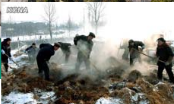
Osuuskuntatilalliset valmistautumassa uuteen viljelykauteen tammikuun pakkasilla.

Koreassa on meneillään rakennusbuumi. Pjongjangin keskusta nousee parhaillaan sarja valtavia pilvenpiirtäjiä.