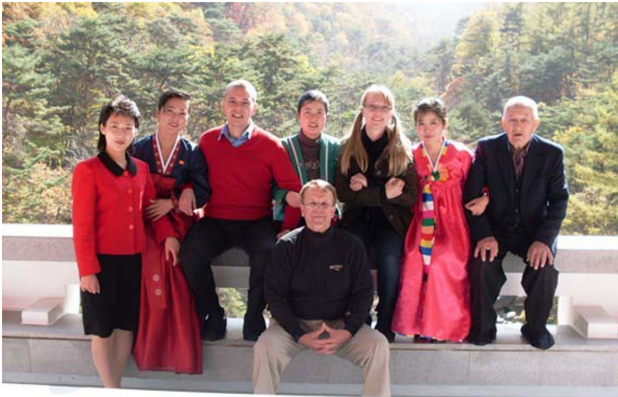
Suomalaisia matkailijoita Myohan-vuoristossa.

Korean dkt parantaa koko ajan omia palvelujaan ulkomaisille matkailijoille. Maasta ei silti ole tulossa Itä-Aasian Teneriffaa vaan jatkossakin talossa eletään tavallaan. Jos kotiolut alkavat tympiä, ota matkalippu kauniiseen käteen ja lähde tutustumaan Koreaan, 2000-luvun eksoottiseen helmeen!