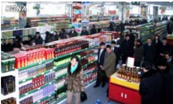
Kwangbokin alueen uusi supermarket avasi ovensa tammikuun alussa.

Seura järjesti 4.1.2012 Helsingissä tilaisuuden Kim Jong Ilin muistoksi. Tapahtumassa pidetyissä puheissa arvioitiin Korean niemimaan tämänhetkistä tilannetta ja tulevaisuudennäkymiä sekä keskusteltiin Kim Jong Ilin merkityksestä Korean lähihistorialle samoin kuin Korean riippumattoman ja rauhanomaisen jälleenyhdistämisen hyväksi.