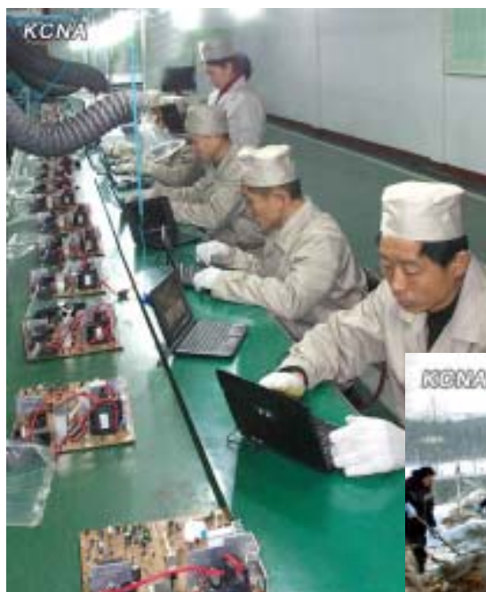
Hana-elektroniikkatehtaan insinöörit suunnittelemassa uusia tietokoneita tammikuun alussa 2012.