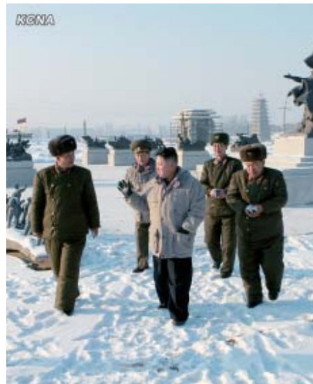
Johtaja Kim Jong Un kävi 11. tammikuuta 2012 tutustumassa rakenteilla olevaan Pjongjangin kansanpuistoon.