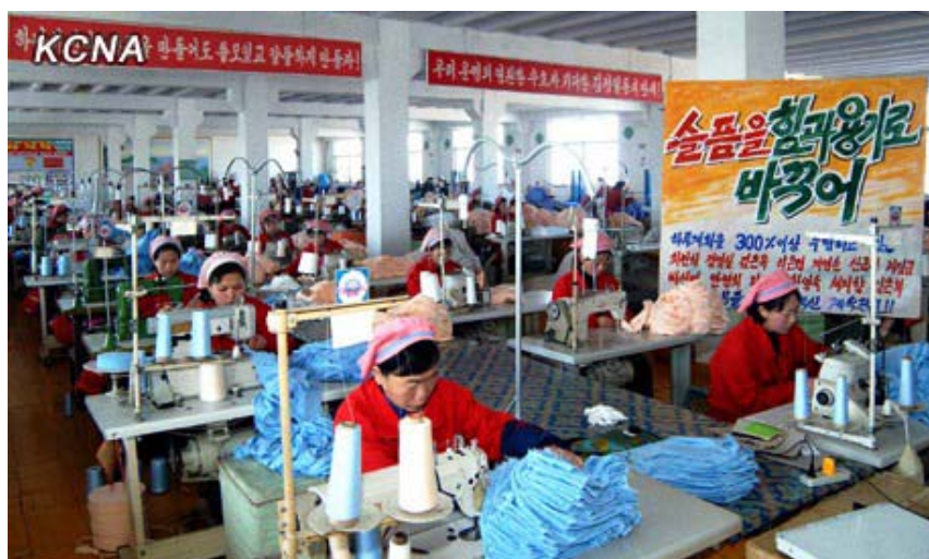
Tekstiilintuotannon kasvu parantaa kansalaisten elinoloja.

Ensi vuonna tulee kuluneeksi 100 vuotta Pohjois-Korean entisen presidentin Kim Il Sungin syntymästä. Korealaiset ovat panostaneet tähän vuoteen runsaasti mm uudistamalla infrastruktuuria ja teollisuuslaitoksia. Näyttää siltä, että sekä luonnon- että ympäristönsuojelun merkitys on kasvamassa Pohjois-Koreassa. Siihen viittaa myös lainsäädännön modernisointi vastaamaan nykyajan vaatimuksia.