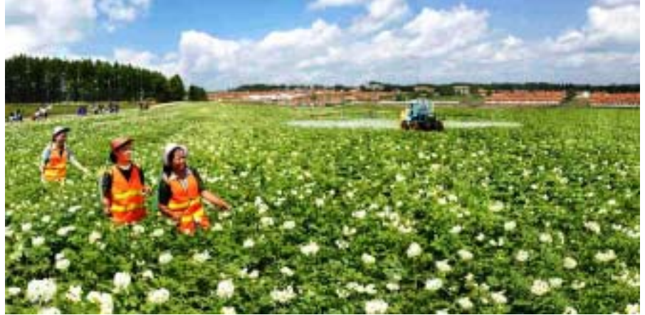
Perunantuotanto etenee Koreassa: Pohjoisessa sijaitseva Taehondagin maakunta tunnetaan KDKT:n perunalääninä.

Pitkäsen mukaan Amdun tila on Korean dkt:ssa hyvässä maineessa ja maan perunantukijat vierailevat siellä