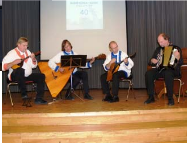
Karjalais-venäläistä tunnelmaa juhlaan toi Shaika Balalaika.

Tukholman suurlähetystön nelihenkinen lapsikuoro ja suomalaisyhtye Shaika Balalaika. Korealais-suomalais-karjalais-venäläiset esitykset täydensivät loistavasti toisiaan. Tilaisuudessa kuultiin muun muassa presidentti Kim Il Sungin ja toveri Kim Jong Ilin laulut sekä sovitukset kappaleista Tumma yö ja Ljubushka.