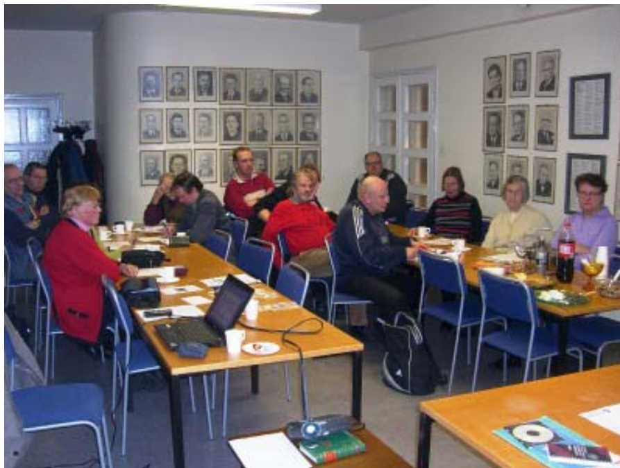
Syyskokous pidettiin Kirjalla.

Kokouksessa käsiteltiin myös seuran ajankohtaisia asioita ja keskusteltiin ensi vuonna käynnistyvästä hankkeesta "Suomalainen tie Koreaan". Vuoden kestävässä hankkeessa Korean dkt:aa lähestytään suomalaisen näkökulman kautta. Hankkeen toivotaan auttavan suomalaisia.