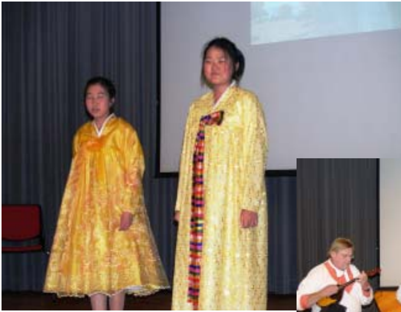
Korean dkt:n suurlähetystön nuoret esiintyjät.

Tukholman suurlähetystön nelihenkinen lapsikuoro ja suomalaisyhtye Shaika Balalaika. Korealais-suomalais-karjalais-venäläiset esitykset täydensivät loistavasti toisiaan. Tilaisuudessa kuultiin muun muassa presidentti Kim Il Sungin ja toveri Kim Jong Ilin laulut sekä sovitukset kappaleista Tumma yö ja Ljubushka.