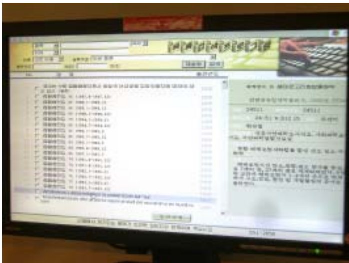
Korealaisten kehittämä Punalippu-käyttöjärjestelmä.

Lähteet: KCNA, Digitoday, itviikko, northkoreatech