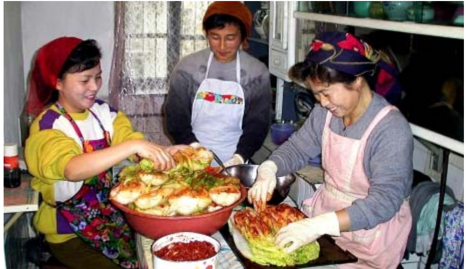
Kimchin valmistus on edelleen perheenemäntien kunnia-velvollisuus.

Kaesongin alueella tehdään possam-kimchiä, jossa kiinankaalin ja chilin