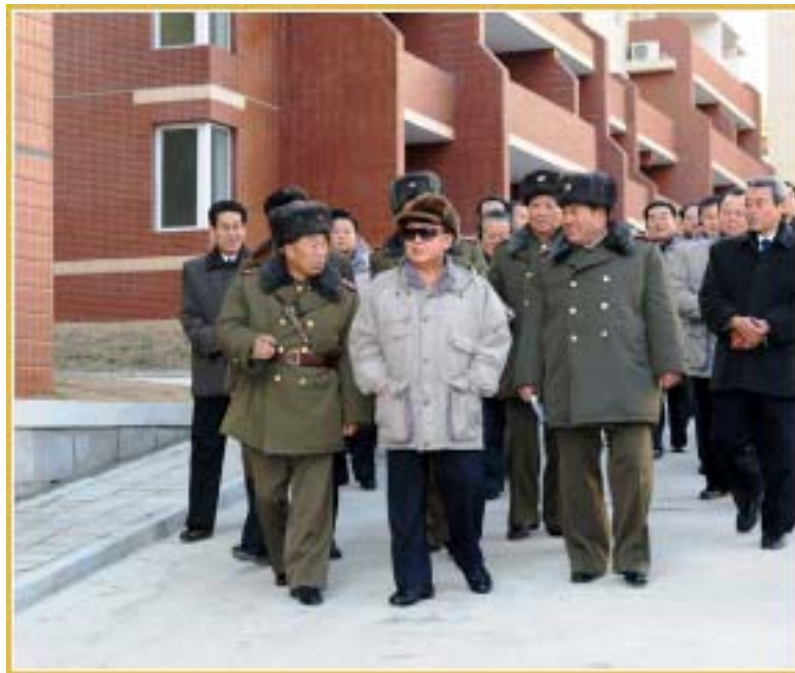
Pääsihteeri Kim Jong Il tutustumassa uusiin kerrostaloalueisiin Pjongjangissa.