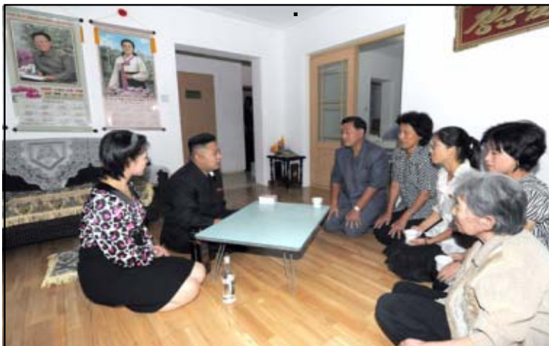
Kim Jong Un ja hänen puolisonsa Ri Sol Ju vierailivat syksyllä 2012 perheiden luona, jotka olivat juuri muuttaneet Changjonin alueen uusiin kerrostaloihin.

Kim Jong Un korosti ensimmäisessä julkisessa puheessaan 15.4.2012 talouden kehittämisen olevan maan tärkein tehtävä. Korean dkt on viimeisten vuosien ajan saanut nauttia talouskasvusta ja elinolojen paranemisesta. Tätä kehitystä ovat edesauttaneet eri tuotannonalojen elpyminen, ulkomaankaupan kasvu erityisesti Kiinaan sekä kulutustavara-tuotannon modernisoituminen. Energia-ongelmat ovat alkaneet helpottua sen jälkeen, kun huhtikuussa Korean pohjoisosassa valmistunut Huichonin jättimäinen vesivoimalaitos käynnisti toimin-