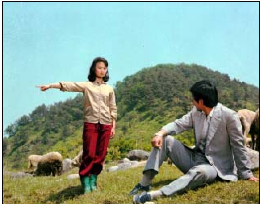
Kuva elokuvasta Torajikkot.

Uhrautuvaa rakkautta –elokuva- päivät herättivät huomiota Korean demokraattisessa kansantasavallassa asti,