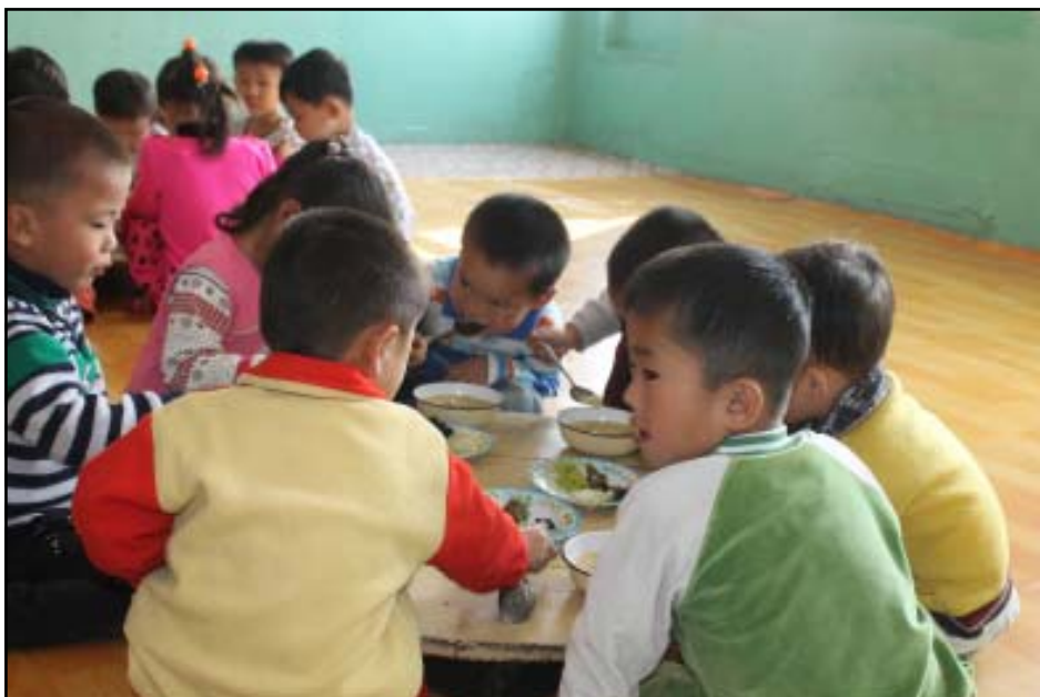
Lapsia ruokailemassa.

Esityksen päätteeksi käytiin vilkas keskustelu. Keskustelussa nousi esiin mm. kehitysyhteistyöhankkeiden mahdollinen päällekkäisyys. KDKT:ssa operoivia järjestöjä on useita. Olli Pitkänen kertoi, että KDKT:n viranomaiset koordinoivat kehitysyhteistyöhankkeet erittäin hyvin eikä tämän vuoksi päällekkäisyyttä pääse syntymään. Avustusjärjestön ja KDKT:n viranomaisten välinen yhteistyösopimus tehdään aina kahdeksi vuodeksi kerrallaan.