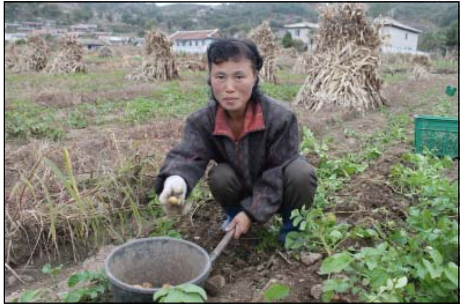
Perunasatoa korjataan.

Vuonna 2013 käynnistyy uusi viisivuotinen, EU:n rahoittama siemenperunahanke. Hankkeen tarkoituksena on pitkäaikainen ruokaturvan parantaminen.