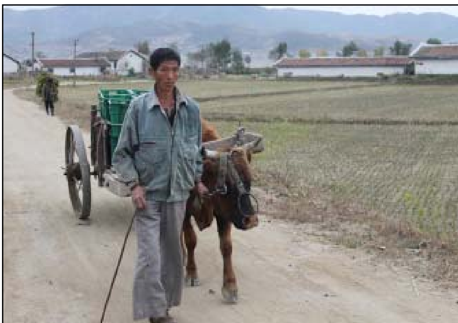
Perunoita kuljetetaan kellariin.

SPR:n lehdet Apua! Katastrofirahasto tiedottaa 3/2012 ja Avun maailma 3/2012.