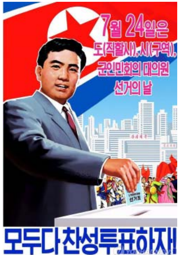
Poster, joka kehottaa äänestämään vaaleissa.

Korkeimman kansankokouksen 687 edustajaa kokoontuvat myös 1-2 kertaa/vuosi. Heidän tehtäviinsä sisältyy mm. äänestää uusista laista ja asetusmuutoksista samoin hyväksyä kansallinen budjetti. Korkein kansankokous nimittää hallituksen sekä maan johdon ja hallinnon muiden tärkeiden tehtävien henkilöt. Korkein kansankokous valitsee myös pysyvän komitean ja valiokunnat, jotka työskentelevät kansankokouksen täysistuntojen välillä ja toimivat valmistelevana elimenä. Pysyvän komitean puheenjohtaja on tasavallan valtionpäämies. KDKT:n muodollisesti korkein virka on kansallisen puolustuskomission puheenjohtaja.