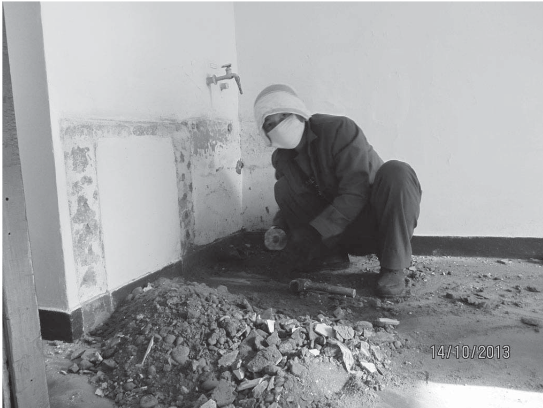
Potongganin sairaalan korjauksessa lähdettiin liikkeelle perusasioista.