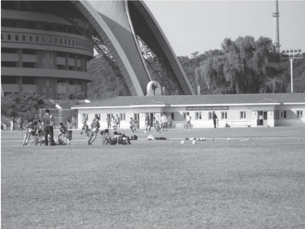
Jalkapallokoululaiset harjoittelevat Vapun päivän stadionin kupeessa.