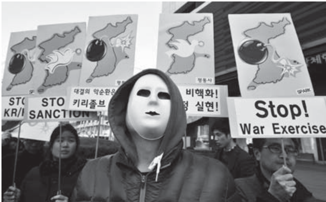
Eteläkorealaiset protestoivat USA:n ja Etelä-Korean sotaharjoituksia vastaan.

Tuleva solidaarisuuskuukausi on hyvä hetki viettää eteenpäin viestiä solidaarisuudesta sekä rauhan ja jälleenyhdistämisen asiasta.