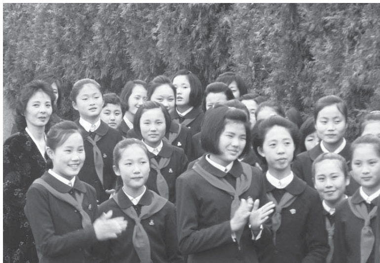
Pjongjangilaisia pioneerityttöjä.