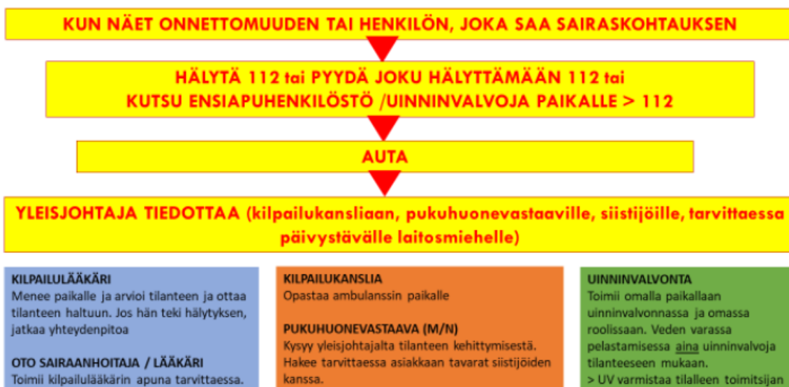
KUVA 2. Toiminta kilpailuissa tapaturma-, onnettomuus- tai sairaskohtaustilanteissa.