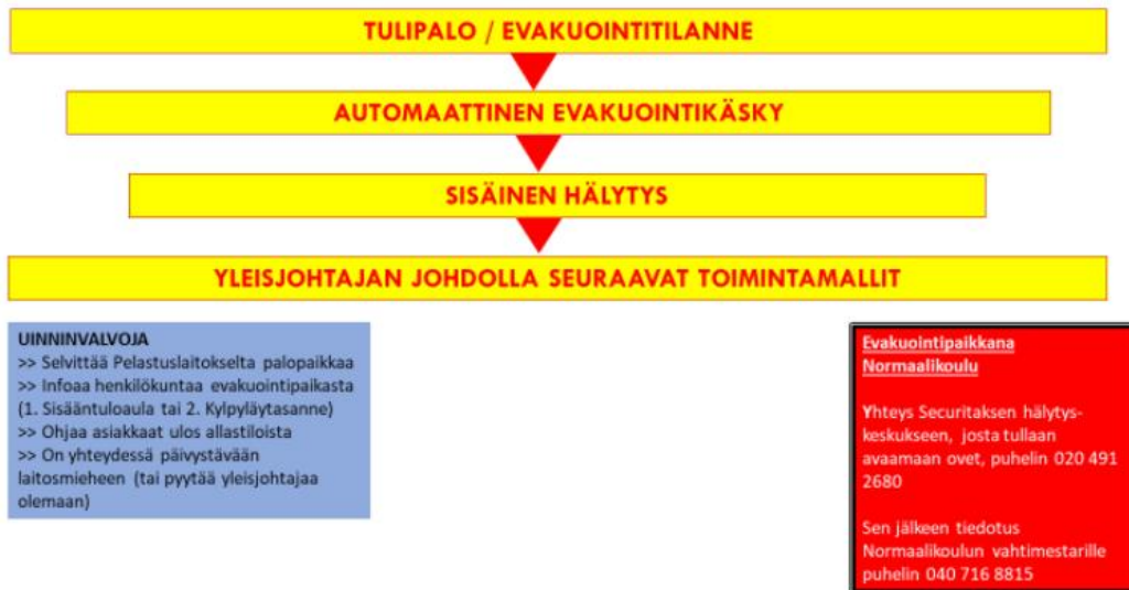
KUVA 1. Toiminta kilpailujen aikana tulipalo- ja evakuointitilanteissa.