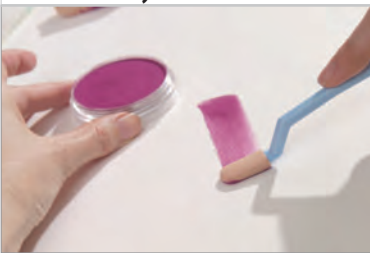
KÄYTÄ KUIN MAALIA

Ota väriä ja levitä Sofft Tools -työkalulla