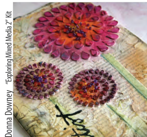
Donna Downey "Exploring Mixed Media 2" Kit