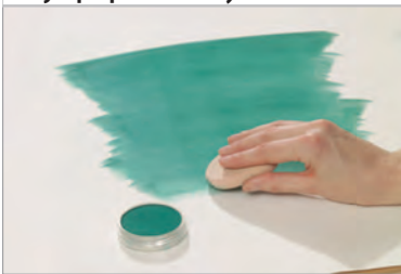
PEITÄ ISOT ALUEET

Nopeasti ja helposti – taustat ja paperin sävyttäminen