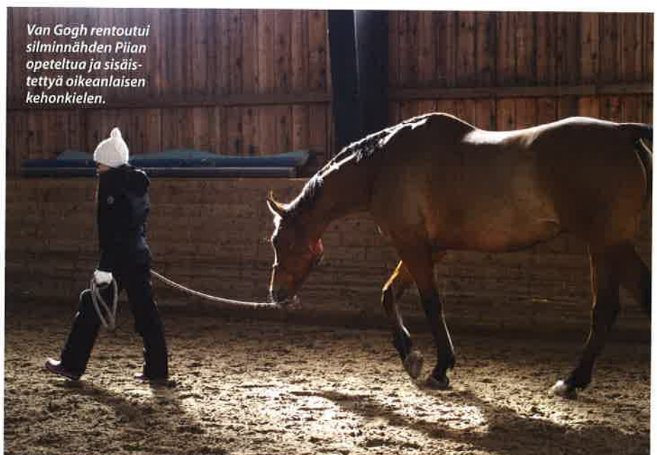
Van Gogh rentoutui silminnähdessä Piian opeteltua ja sisäis- tettua oikeanlaisen kehonkielen.

Hetken kuluttua harjoitellaan uuden pyynnön toteuttamista. Tällä kertaa Van Goghin pitäisi peruuttaa. Piia saa vapaat kädet tehtävän suorittamiseen. Hän työntää ruunaa otsasta, mutta ruuna ei hievahda. Hetken mietittyään Piia muistaa riimunarun ja heilauttaa sitä kevyesti. Van Gogh peruuttaa ja Piiaa neuvotaan lopetta-