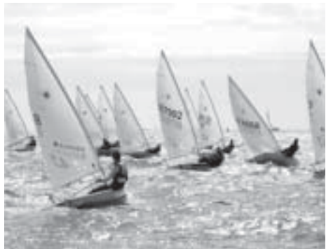
Laser 4,7 95-vuotisjuhlaregataassa.

Sivustosta tuli aiempaa helpommin päivitettävä. Päivitysoikeudet voitiin nyt antaa mm. kaikille hallituksen jäsenille. Jokainen päivittää vastualueensa, jolloin päivitysvastuu saatiin jaettua järkevällä tavalla, jolloin sivujen ajankohtaisuus säilyy.