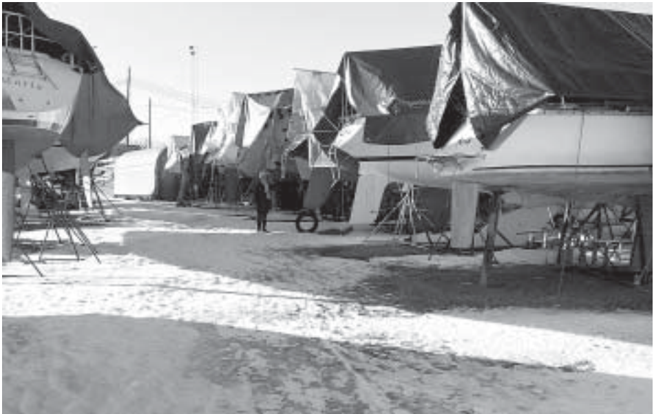
Sirpalesaari 15.2.2009