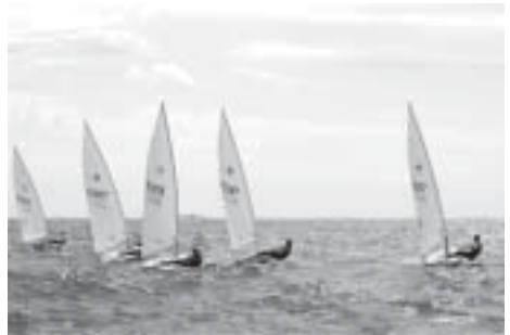
Laser Standard Ranking 95-vuotisjuhlaregataassa, kuva Satu Lehesmaa.