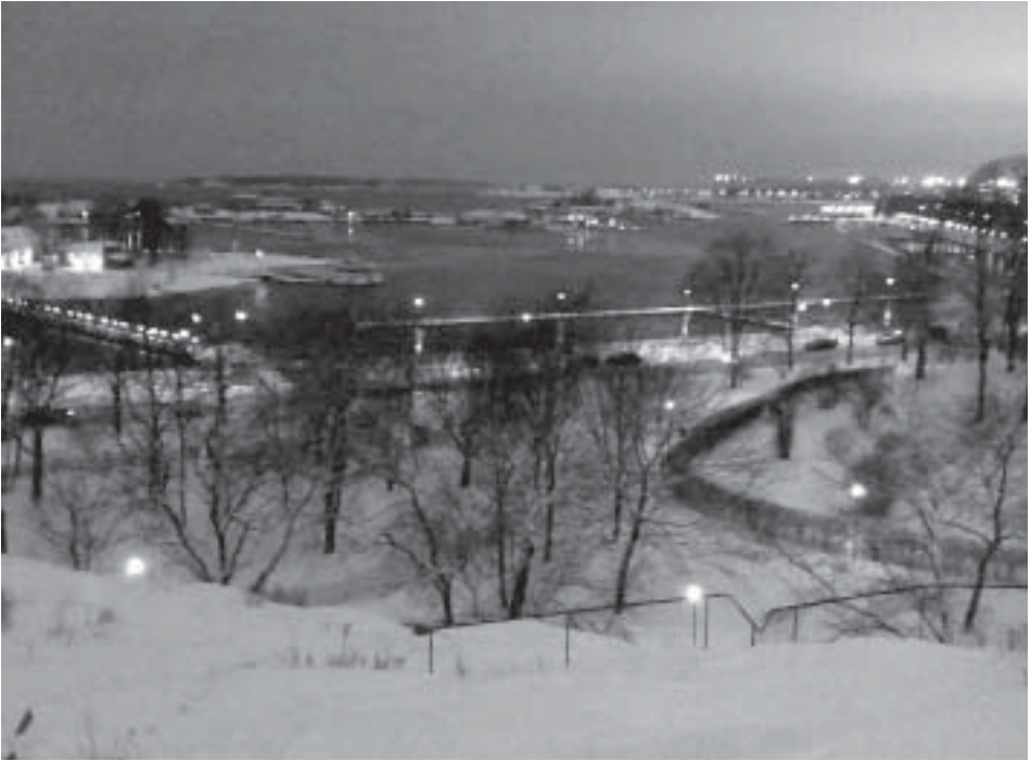
Sirpalesaari tammikuussa 2009, kuva Eero Mörä.