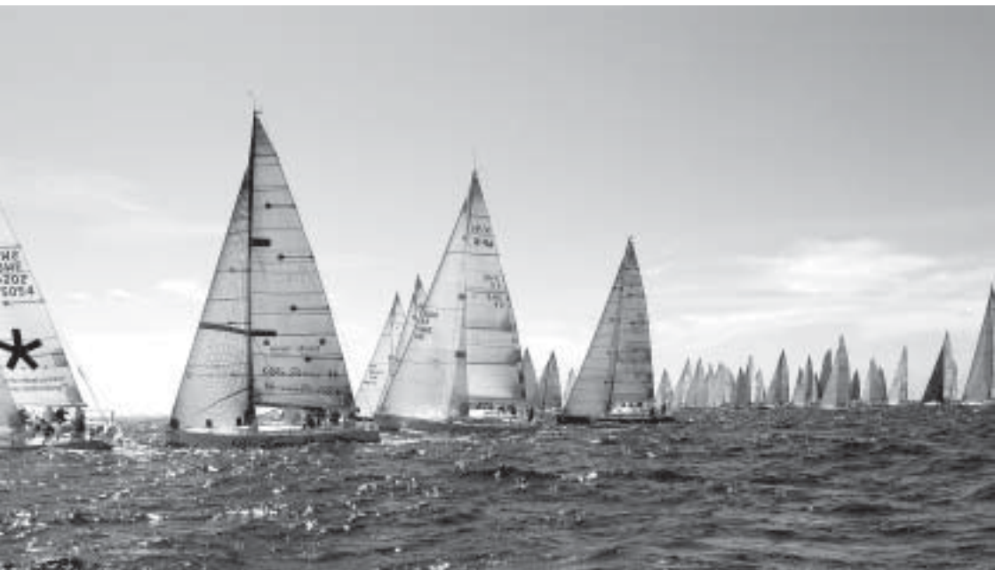
IMS1-luokan startti, Gotland Runt 2007