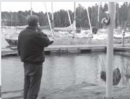
Kuvat Eero Mörä

opetti mielenkiintoisia asioita seilorille tärkeästä luonnosta ja maailmankaikkeudesta, yhdessäoloa siivittivät niin tikan, kettingin kuin veden heittokin. Eskaaderiin osallistui 7 venekuntaa.