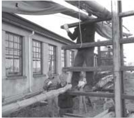
Mastotelineisiin tehdään tilaan aktiivikäytössä oleville mastoille.

SPS:n syystalkoisiin Sirpalesaaressa osallistui reilu 70 seuran jäsentä. Lähes kesäisessä kelissä parannettiin vartiojollan slipiä, rakennettiin varustekaapin runko marinakomerorakennuksen seinustalle, tehtiin vesomishommia, topparoikka vaihtoi torninosturin radan pölkkyjä, yli kesän mastotelineissä säilytettyjä mastoja siirrettiin toisaalle ja tehtiin näin tilaa aktiivikäytössä oleville mastoille sekä siivottiin telakkakenttää ja -vajaa ym. Talkoot päättyivät hernerokkaan ja virvokkeisiin ravintola Saaressa.