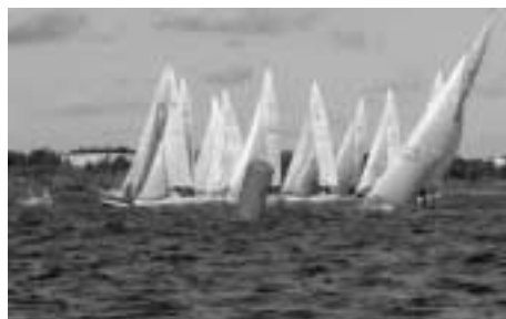
SPS:n järjestämän X-99 Rankingin lähtö 19.9.2009

Lipunlaskussa 2.10.2009 luovutettiin SPS:n ansiomerkit seuraaville henkilöille: