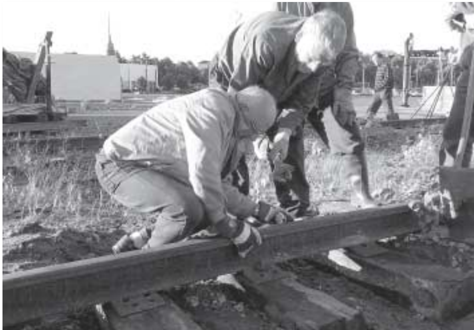
Topparoikka korjaamassa torninosturin rataa.