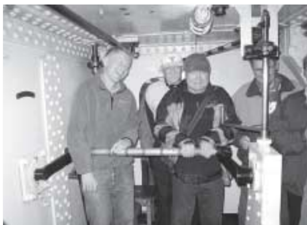
SPS:n miehet suuntaavat koroa - vai oliko se sivua?