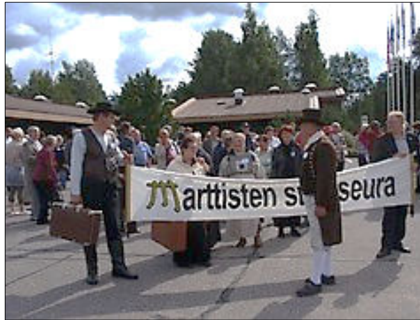
Amerikan päivät Rautalammilla v. 2011

Kaikki Marttisen sukuun kuuluvat ovat tervetulleita sukuseuran jäseniksi!