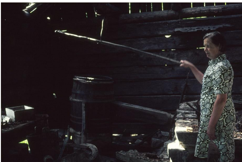
Vihtaniemen vanha paja sisäpuolelta