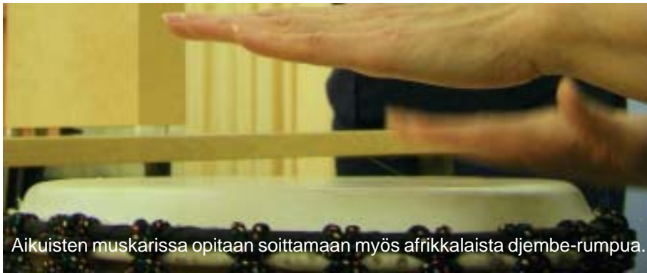
Aikuisten muskarissa opitaan soittamaan myös afrikkalaista djembe-rumpua.

Aistien kautta saamme paitsi tietoa ympäröivästä maailmasta, myös makua, väriä ja sykettä elämään. Marraskuisen viikon aikana SampolAviisin toimittaja kurkisti kolmelle opiston kurssille, joissa aistit pääsevät pääosaan.