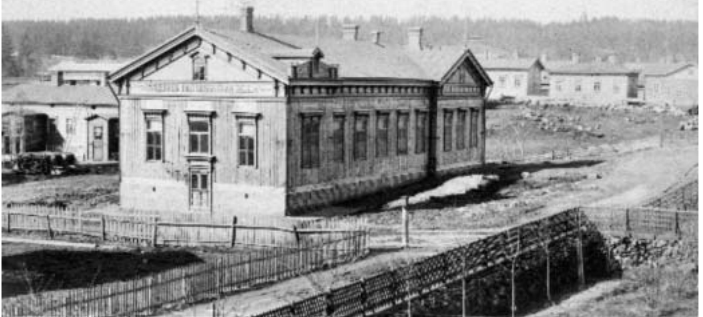
Työväenopisto aloitti toimintansa Raittiustalolla Satakunnankadun ja Mustanlahdenkadun kulmauksessa.

Lähde: Teuvo Virtanen, Suomen ensimmäinen työväenopisto 75 vuotta. Tampereen työväenopisto 1899-1974. Tampereen Keskuspaino 1975.