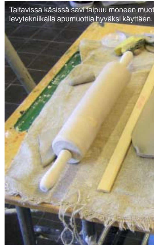
Taitavissa käsissä savi taipuu moneen muotoon levytekniikalla apumuottia hyväksi käyttäen.

Sekä Salmista että oppilaita kiehtoo keramiikassa käsillä tekeminen. Saven käsittely rentouttaa ja siinä näkee nopeasti työnsä tuloksen. Vaihtelua tuovat myös monet erilaiset muotoilutekniikat.