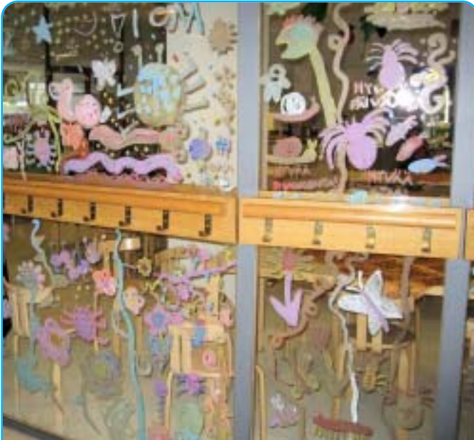
Sampolassa vietettiin Unicef-päivää 11.11.2008. Sara Hildén-Akatemian Kuvataidekoulun oppilaat maalasivat kahvion lasiseiniin iloa syksyn keskelle.