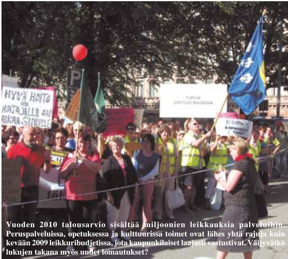
Vuoden 2010 talousarvio sisältää miljoonien leikkauksia palveluihin. Peruspalveluissa, opetuksessa ja kulttuurissa toimet ovat lähes yhtä rajuja kuin kevään 2009 leikkuribudjetissa, jota kaupunkilaiset laajasti vastustivat. Väijyvät lukujen takana myös uudet lomautukset?

Opetuksessa nykyisen palvelutason ja budjettiesityk-