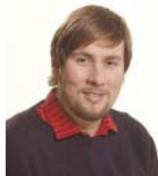
Paavo Arhinmäki Vasemmistoliiton puheenjohtaja

Tällaisen oikeudenmukainen verouudistus vaatii poliittisten voimasuhteiden muutosta. Nyt tarvitaan vahvaa vasemmistoa!