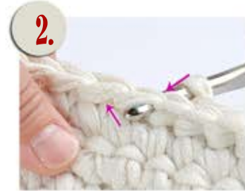
2. Pohjakäännöksessä vie koukku s:n takaa eteen ja seuraavasta välistä taas taakse.

Jatka suoraan pohjakäännökseen. Tämän krs:n jälkeen työ etenee ylöspäin korin reunoina. Tuo koukku työn takaa ks:n edestä työn etupuolelle ja toiselta puolen takaisin työn taakse (kuva 2). Ota kude koukulle (kuva 3), vedä läpi (kuva 4) ja tee ks. Krs:n jälkeen silmukkamäärä on pysynyt samana.