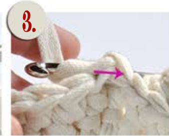
3. Vedä kude tästä läpi...