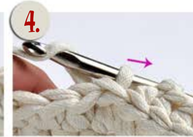
4. Päätä kiinteäsilmukka. Toista sama jokaisesta s:n välistä kierros ympäri.