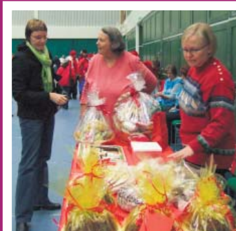
Joulumyyjäisissä on aina oma hieno tunnelmansa.