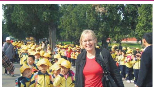
Ulla ollut luomassa kansainvälistä koulu yhteistyötä eri maihin niin itään kuin länteen. Kuva Kiinasta.