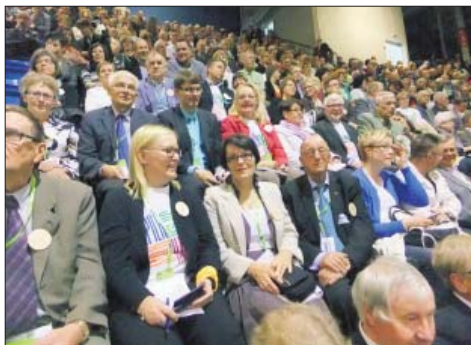
Todellinen kansanliike Suomen Keskusta Rovaniemen puoluekokouksessa 2012.