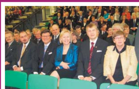
Naapurikuntien edustajia Kuusamon 140-vuotisjuhlassa Ullan ympärillä.