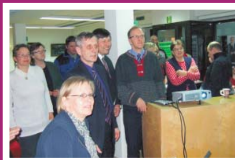
Vaalitulokset jännittävät joka kerta.