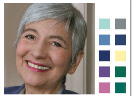
VASTAKOHTAINEN EKSOOTTINEN TALVI