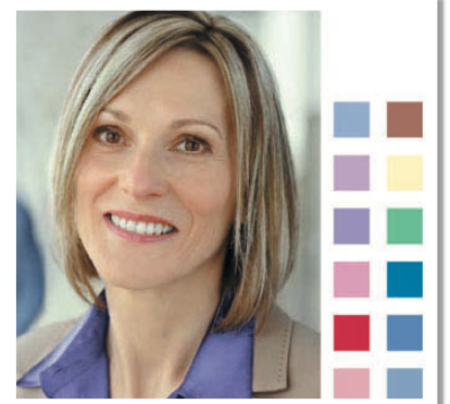
VAALEA GRANIITINPUNAINEN KESÄ