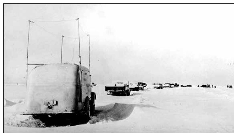
Valkoiseksi kalkittu autokolonna jäätien kinoksissa