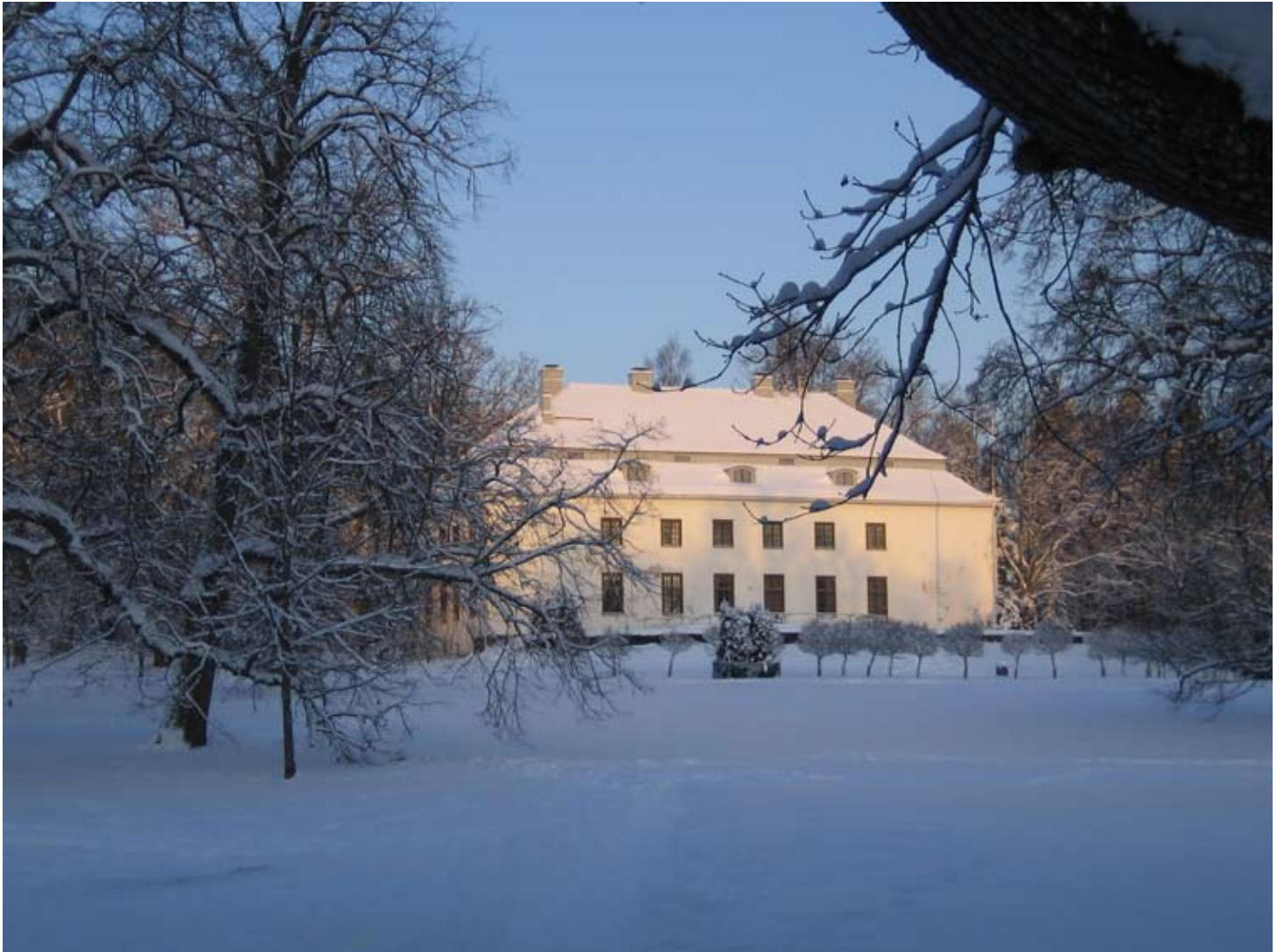
Auroran kartanon päärakennus, Kuva: Yhdistyksen kokoelmat