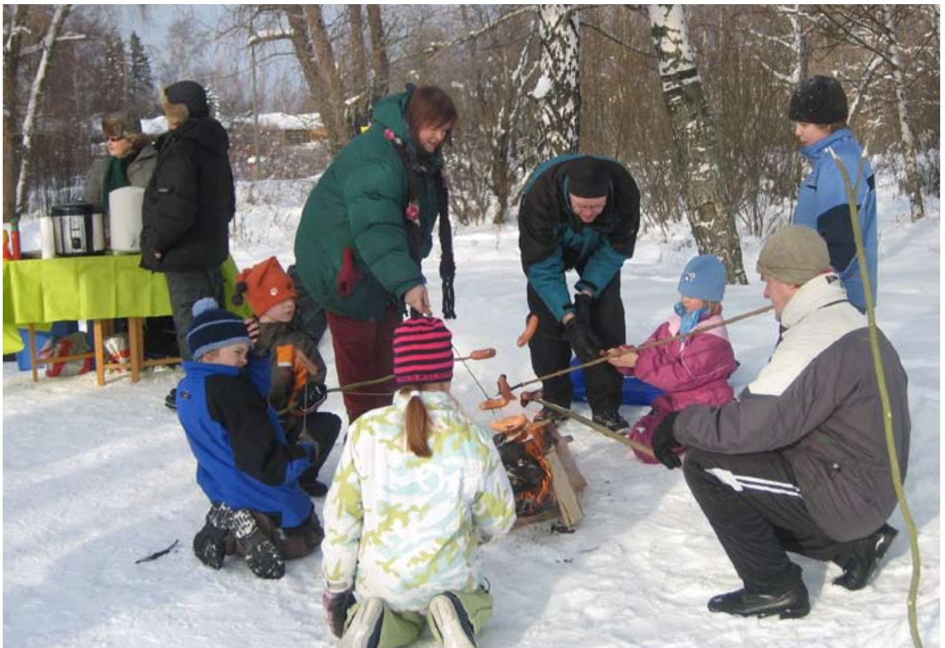
Yhdistyksen tapahtumia: Laskiaisnuotio 2010

Yhteiskunnallinen kehitysvauhti senkun kiihtyi. 90-luvun alku oli voimakkaan taloudellisen kasvun aikaa. Kouluhin satsattiin. Aurora sai lisäksi arvokasta lisäresurssia mm. kulttuuri- ja raittustoimistoilta. Aurorasaa kokeiltiin kaikenlaista mm. sanallisen arvioinnin ulottamista viidennelle luokalle saakka. Aloitimme valinnaiskurssit vuonna 1993. Vuonna 1991 otettiin käyttöön uudenlainen päivänrytmi: keskelle päivää tuli siesta. Koulu ja luokkatoimikunnat herättivät henkiin Aurora-päivän vuonna 1990. Toimimme myös opettajankoulutuslaitoksen kenttäkouluna - ja yhtenä vuonna meillä suoritettiin jopa päättöharjoittelu.