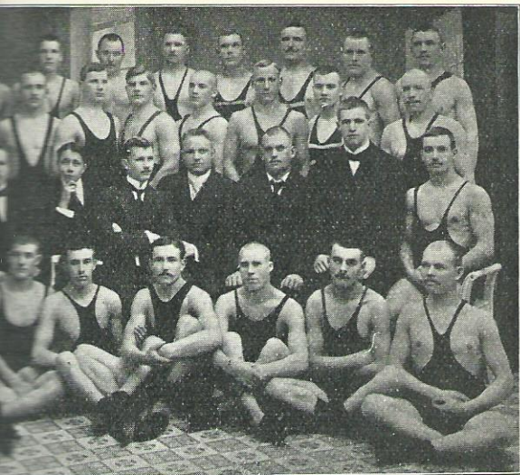
kansainvälisten painikilpailujen osanpalkintotuomarit 10—12. X. 1913.

enmässä ajassa laski, Toverit, alle 60 kg.): V:ri 3 v 1 r., Imatra, 2 v. 2 Riento, Kotka,