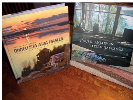
Tyylikkääät kirjankannet kutsuvat lukijaa.