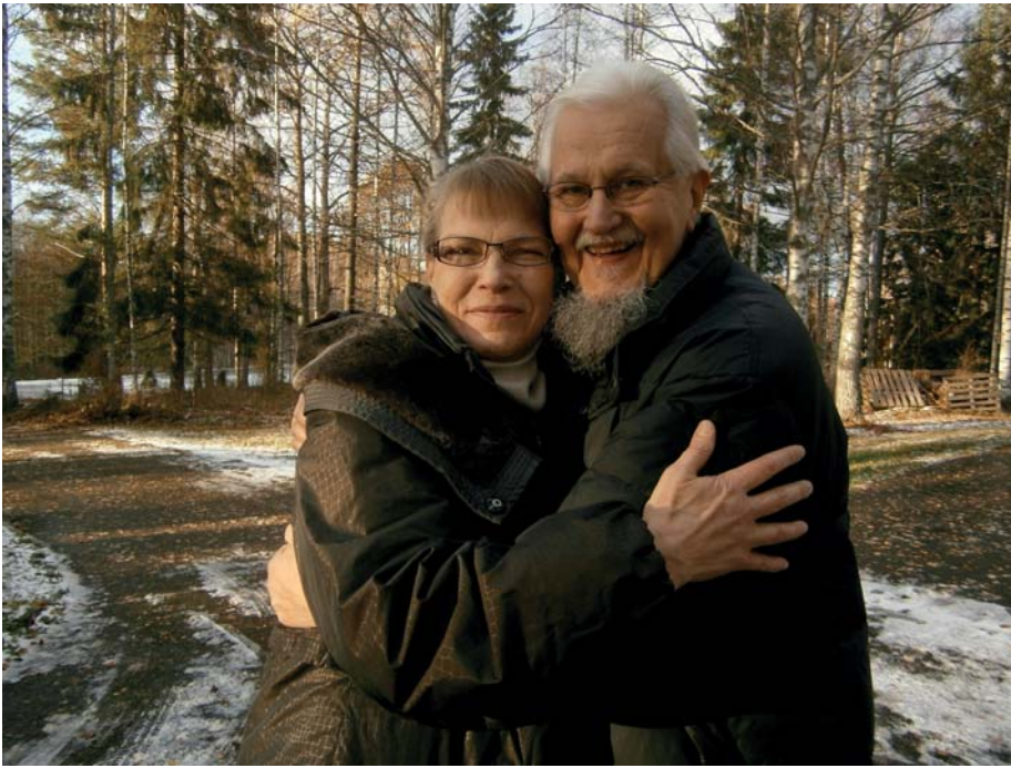
Sukuseuran entiset puheenjohtajat tapasivat ensikertaa. Vastaanotto oli sydämellinen.

Ajelemme aurinkoisena lokakuun iltapäivänä mutkaista maaseututieitä Vääkystä kohti Lammia, joka nykyään kuuluu Hämeenlinnan kaupunkiin. Puut hehkuvat keltaisen ja punaisen sävyissä, Vesijärven Lahdenpohjukka on sinistäkin sinisempi. Pitkän ja loivan mäen päällä käännyimme vasemmalle kohti tapaamispaikkaamme. Alhaalla avautuu rauhallinen maalaismaisema laidunmaineen, joilla ylämaankarja käyskentelee. Kauempana siintää Pääjärvi.