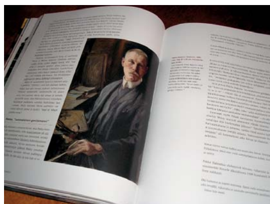
Molemmissa kirjoissa on korkeatasoinen kuvatarjonta.