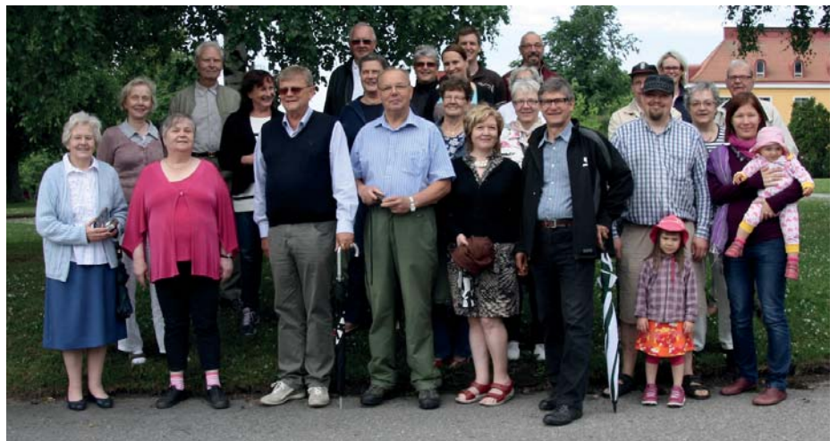
Lepaan kiertäjät ryhmäkuvassa.