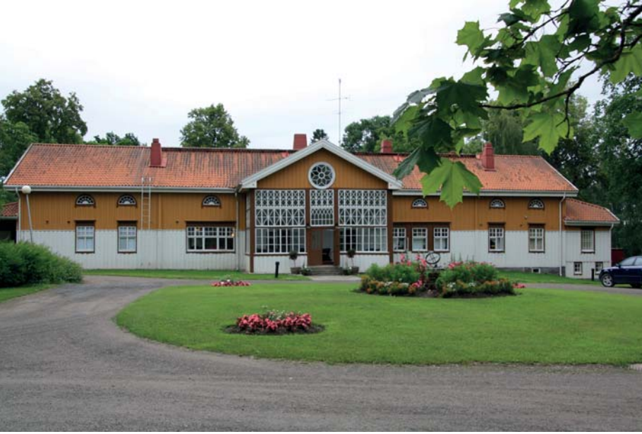
Vanhan kartanon päärakennus Lepaalla.